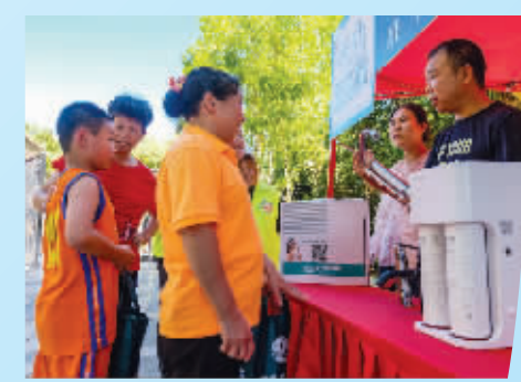
节水斗阵行，扫码答题PK赢奖品