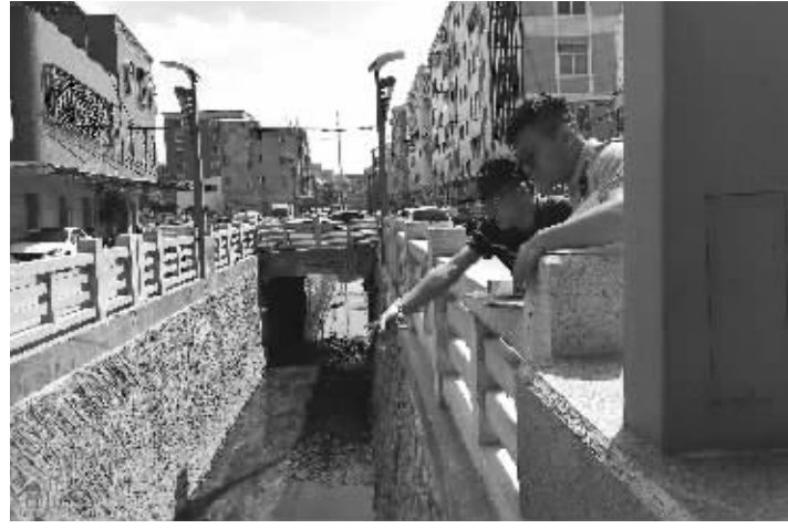
记者，近期，针对因人员变动对河道情况不熟悉、基层巡河内容与标准不一、排查问题不够全面等一系列问题与苗头，在市政府分管领导的要求下，石狮市、镇(街道)两级河长办联合开展巡河大排查活动，重点放在了“巡找查”上——“巡”。从5月16日起，市河长办、市级河道专管员与镇(街

本报讯 5月6日至18日，石狮市、镇(街道)两级河长办联合开展“巡找查”巡河大排查专项行动。市、镇(街道)两级河长办工作人员及河道专管员面对面指导、手把手纠正，踏遍全市15条主要河流70多公里河道以及部分支流，扎实推进全市河湖长制工作落深落细落实。 2017年全面推行河长制以来，石狮市在全市15条县级主要河流和2座水库实施河(湖)长制，从水资源保护、水域岸线管理保护、水污染防治、水环境治理、水生态修复、执法监管等六个层面，全面提升河湖水质。市河长办建立每月河道考评机制，形成“河道病历卡”，强化监督考核，督促指导镇(街道)河长办从根源上治理解决河道问题。 市河长办有关负责人告诉