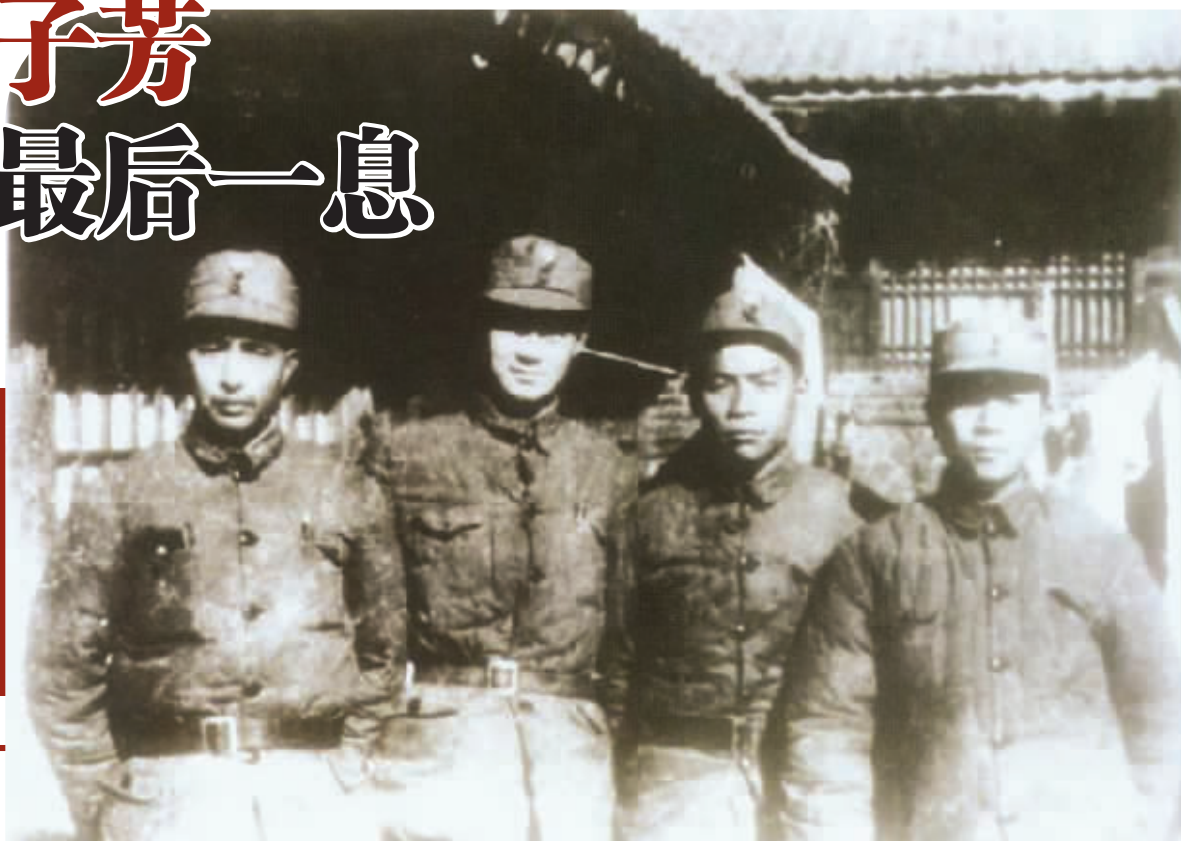
1937年10月,李子芳(左一)在延安抗大三期五队学习时留影

他是福建省乃至全国为数不多走完二万五千里长征的归国华侨之一——李子芳。在石狮,有为他而建的李子芳纪念馆,以他的名字命名的街道“子芳路”,家乡人民铭记着他的赤子报国情怀,传承着生生不息的英烈精神。