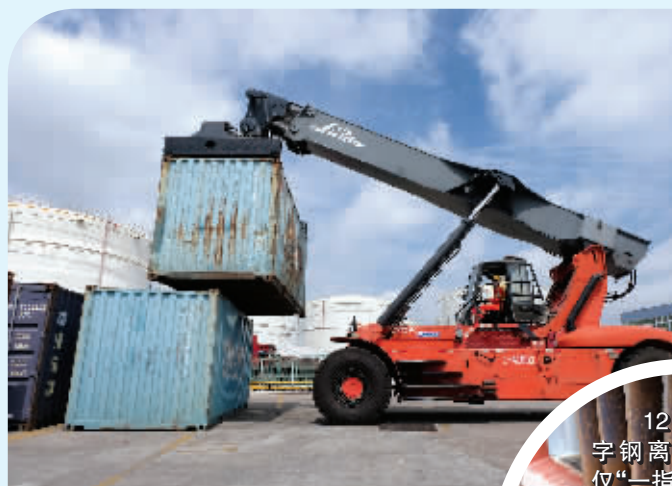
工人驾驶着一台“正面吊”将集装箱整齐堆放