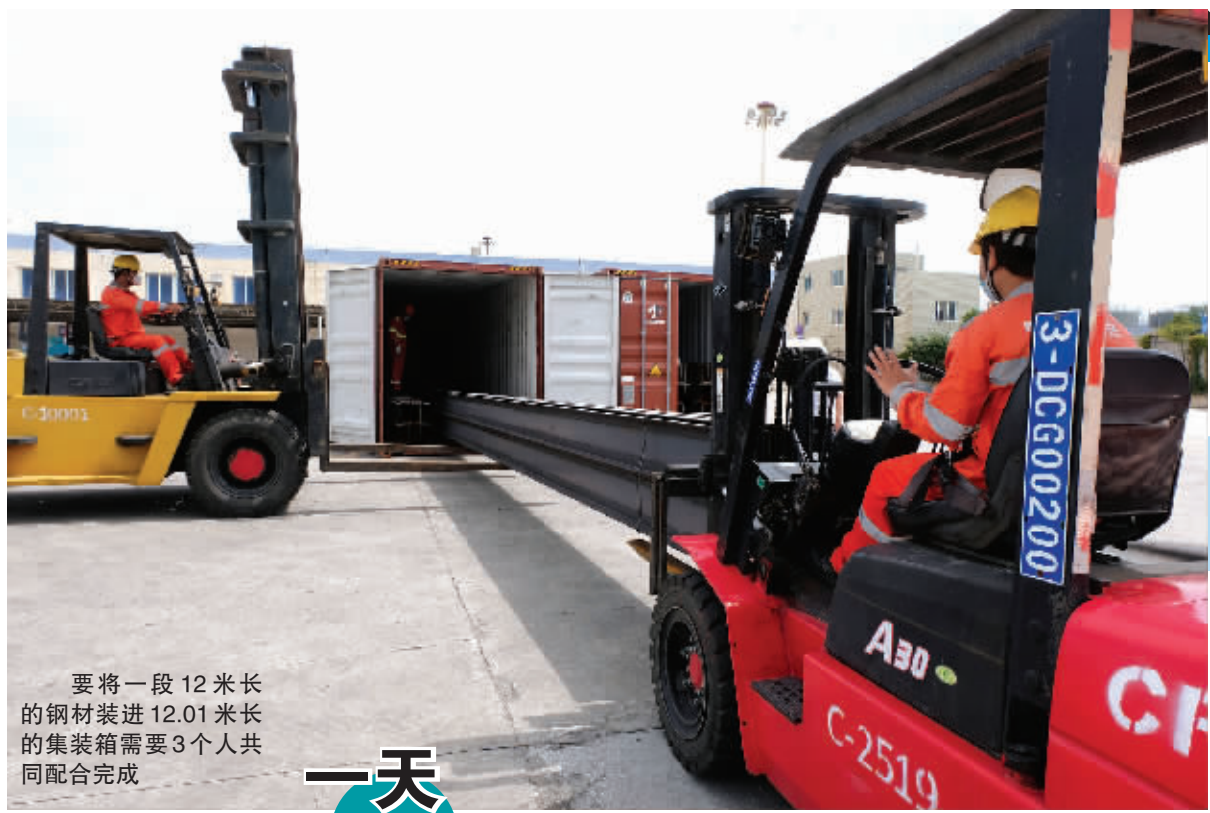
要将一段12米长的钢材装进12.01米长的集装箱需要3个人共同配合完成