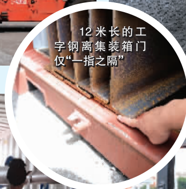
12米长的工字钢离集装箱门仅“一指之隔”