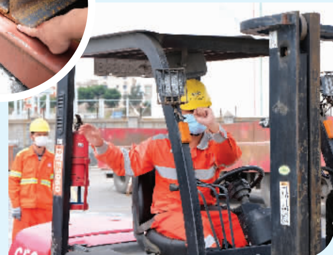
使用专用手势与工友协同作战