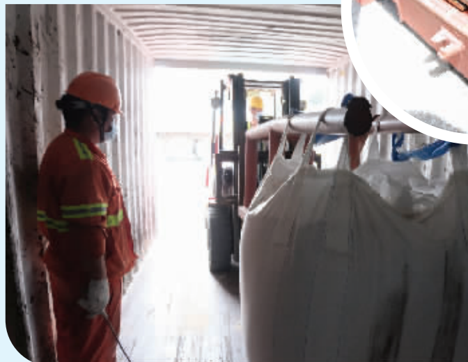
工人自制叉车“延伸臂”,极大方便“太空包”拆箱