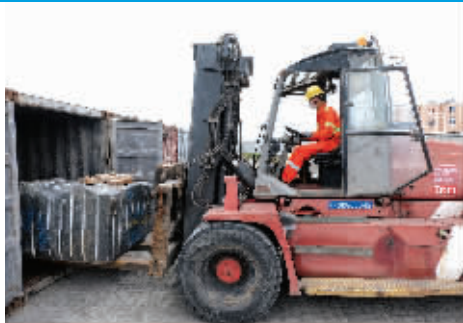
叉车司机将一块20余吨的荒料石装箱