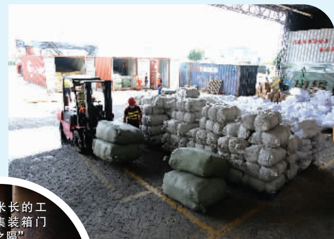
配合海关部门进行各类货物的检验