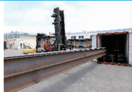
大型的货物装箱和拆箱都需要过硬的技术支持