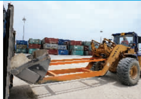
工人驾驶升级改造的铲车将机制砂装进集装箱