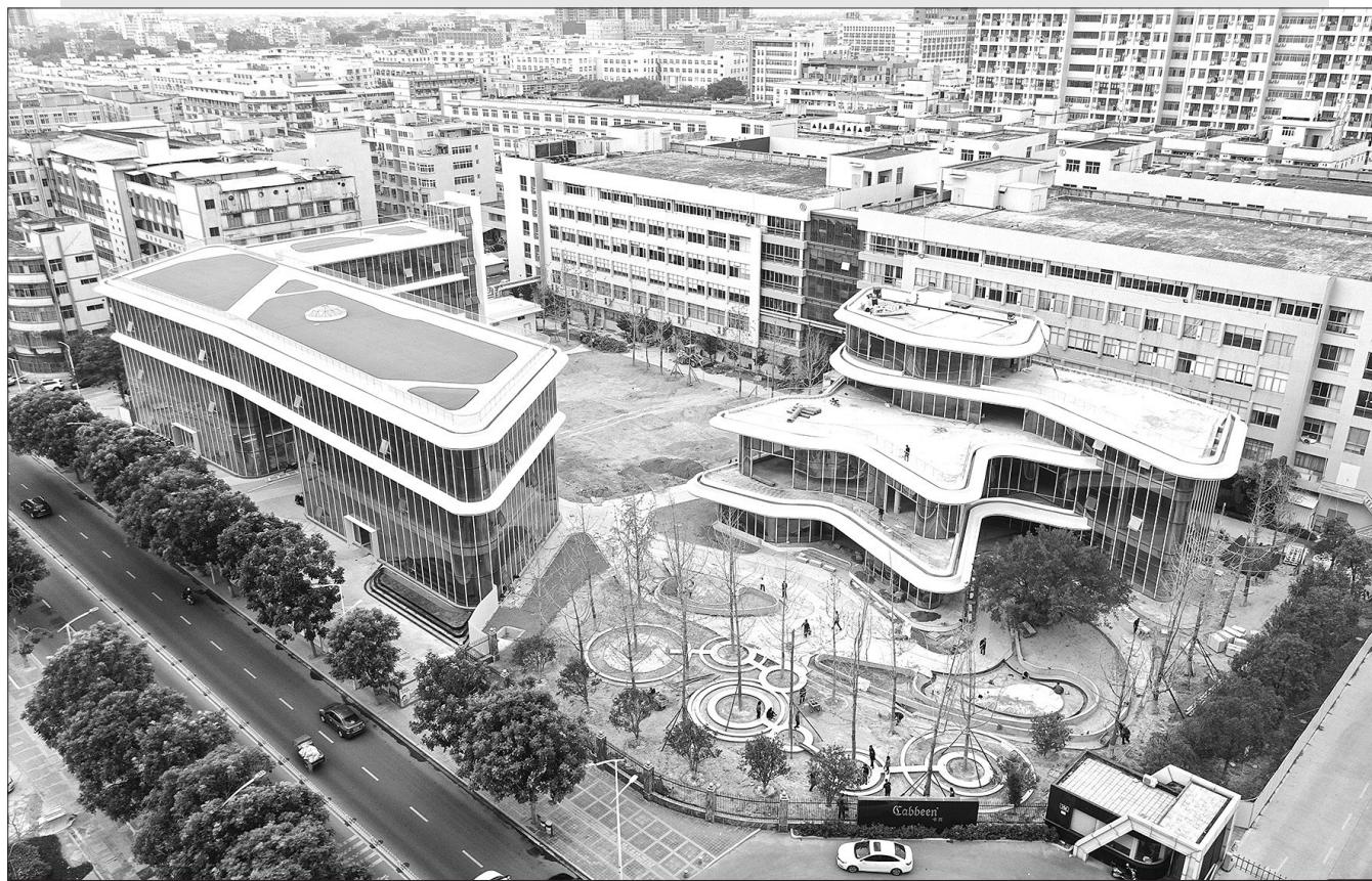
本报讯 近来,宝盖科技园内,有两栋风格鲜明的玻璃幕墙现代主义高层建筑令人眼前一亮,这是卡宾邀请国际顶尖设计机构操刀建设的卡宾创意园。据介绍,卡宾创意园计划于2022年初开业,未来卡宾服饰以及其收购的国际品牌将一起登场“卡宾创意园”,有望成为石狮又一网红打卡地。(记者 张泽业 李荣鑫)