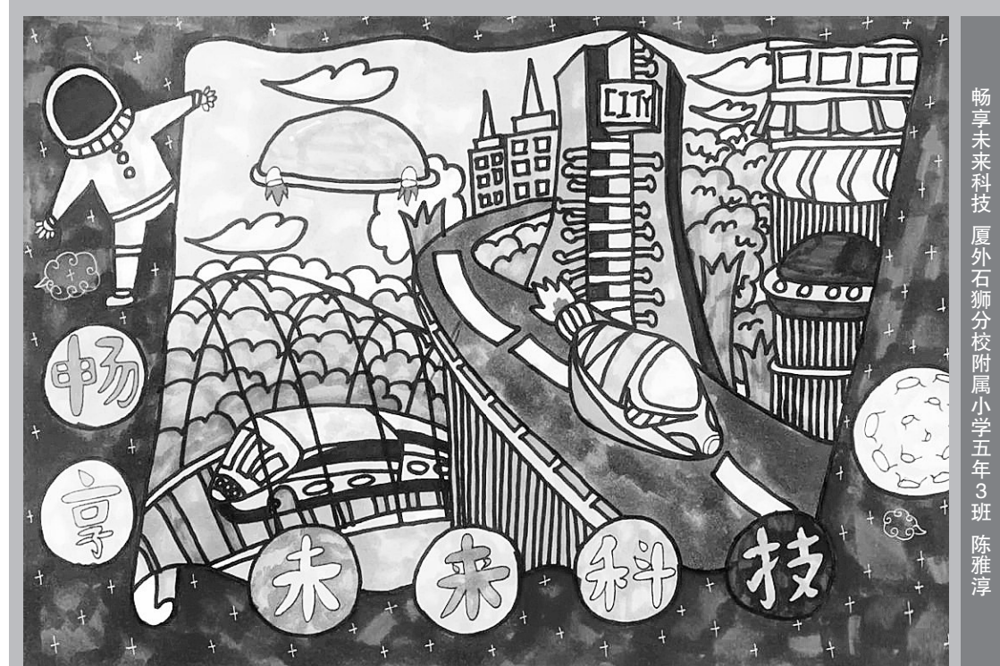
畅享未来科技 厦外石狮分校附属小学五年3班 陈雅淳