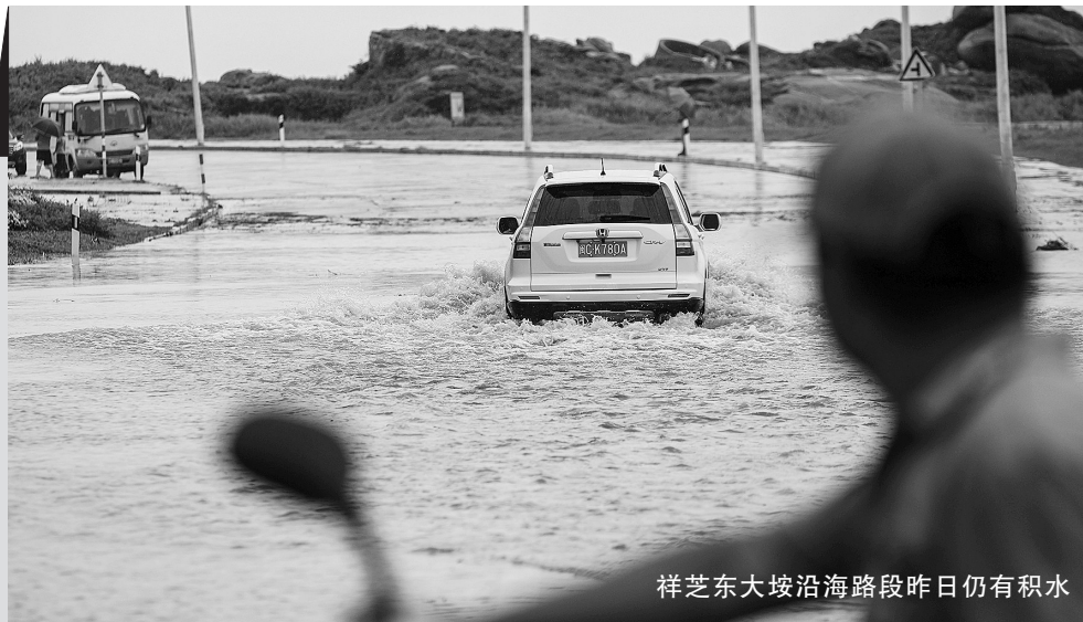
祥芝东大垵沿海路段昨日仍有积水

本报讯 “暹芭”残余环流送来水汽,7月5日至6日晨,石狮出现暴雨到大暴雨,6日白天阵雨停息,下午甚至迎来了久违的阳光。根据石狮气象台消息,8日开始,副热带高压这个大火炉逐步“收复失地”,石狮以晴热天气为主,气温迅速攀升,最高气温将升至33℃。