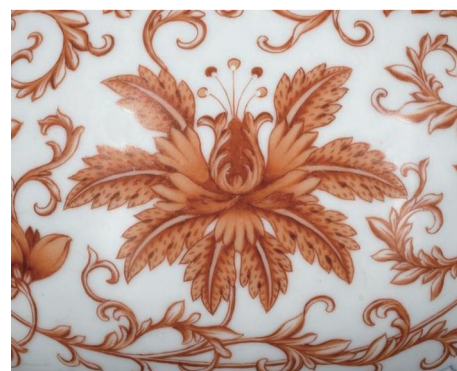
图3 西番莲纹饰（一组）