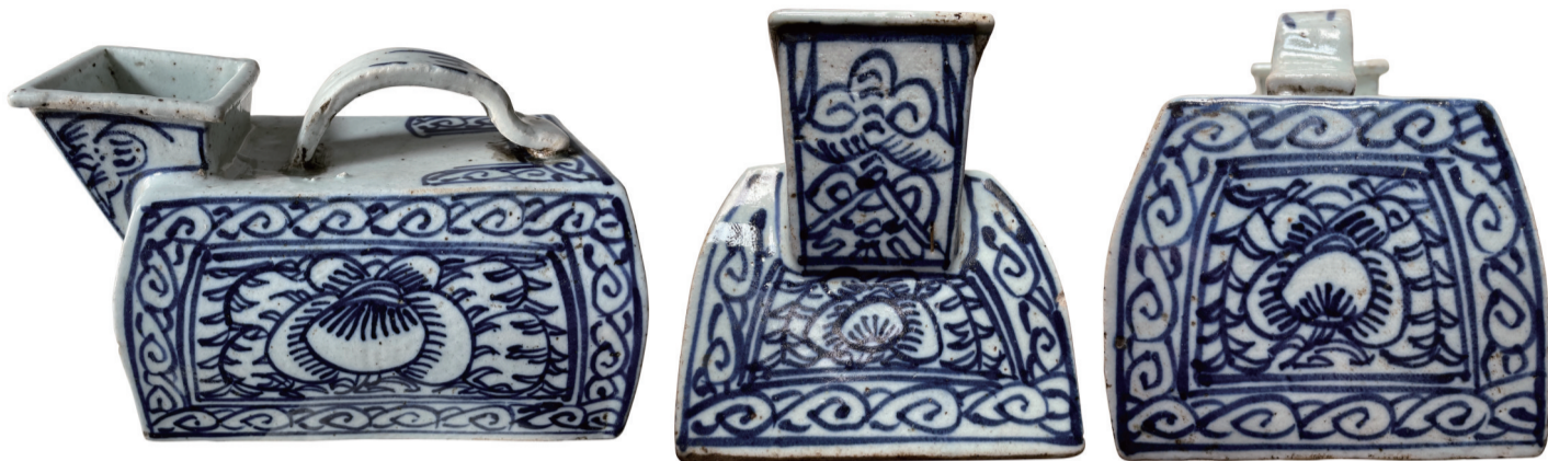
图1 清道光青花瓷虎