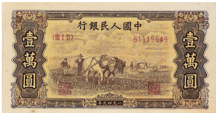
图1 壹万圆“双马耕地”