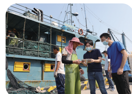
祥芝港进行气象宣传