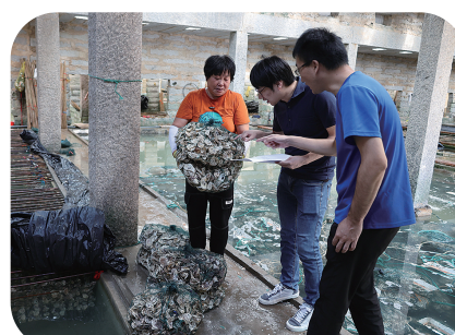
古浮开展气象指导