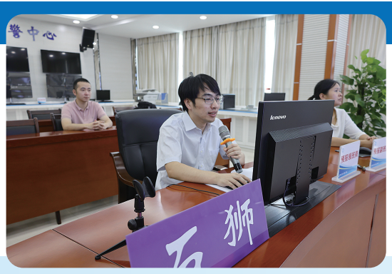
参加省市县天气会商