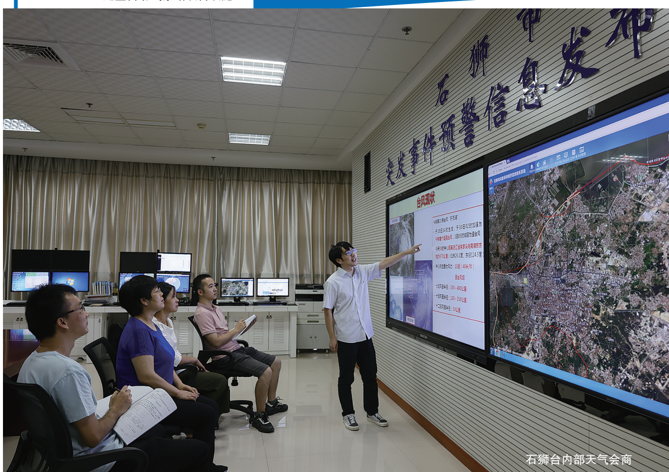
石狮台内部天气会商