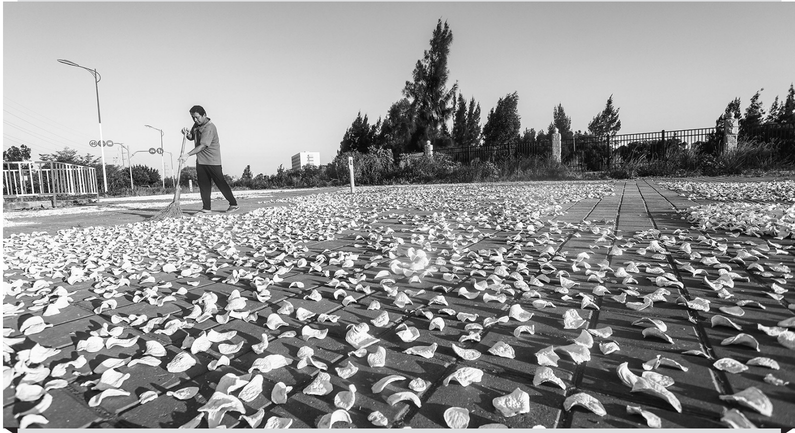
本报讯 10月11日,记者在共富路后湖村段看到,一块空地上,地瓜种植户老黄正在翻晒地瓜干。每年的此时,正是地瓜成熟的时候,老黄都会将采收的新鲜地瓜清洗、削皮、切片后拉到空地上晾晒。老黄告诉记者,天然晾晒的地瓜干是石狮人餐桌上的美味,他每年晾晒的地瓜干都供不应求。 (记者 颜华杰)