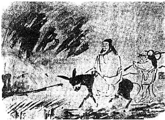
图2 徐端本绘《驴背诗思图》

一名被苏州的一位厨师夺得,他的菜品叫“全家福”。电视台记者到我家采访时问我,怎么想起来这样的构思,我把龙泉窑瓷片拿给他们看,又向他们介绍了龙泉窑的历史,讲那一对淳朴憨厚的船家夫妻。他们听着,感慨地说:小瓷片有大学问,你这是让文物活起来啊!