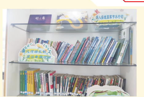
11月17日,由市河长办重点打造的石狮市水生态文明图书角,亮相市旅游集散中心。此外,我市9个镇(街道)水生态文明图书角也已相继落成启用。(记者王国良)