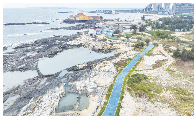
近日,记者前往洛伽寺—观音山段看到,又一段湛蓝的临海慢道建成,让“十里黄金海岸”观光栈道持续完善。“目前,海洋世界—洛伽寺入口段刺路灯待安装,洛伽寺—观音山段刺一座栈桥和观景平台还需铺装面层,年底就可以完工。”城建公司相关负责人介绍道。(记者康清辉 李荣鑫)