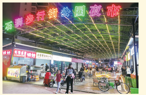
夜幕降临,在石狮市步行街夜市一角,绽放的霓虹灯,编织了夜的美丽。目前,新潮社区正在推进步行街夜市的“微改造”,提升夜市的吸引力。(记者黄翠林 郭雅霞)