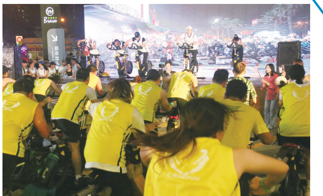
11月12日,石狮市第二届千人单车活动在泰禾广场举行,现场动感的旋律陪伴着选手的骑行,吸引了众多市民驻足观看。(记者陈嫣兰 郭雅霞)