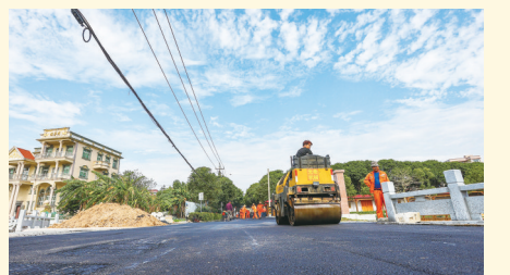
11月14日,厝仔村乡土文化生态园附近路段,施工人员操控着沥青摊铺机作业,拉开了该村第二期道路“白改黑”工程沥青摊铺施工序幕。(记者兰良增 颜华杰)