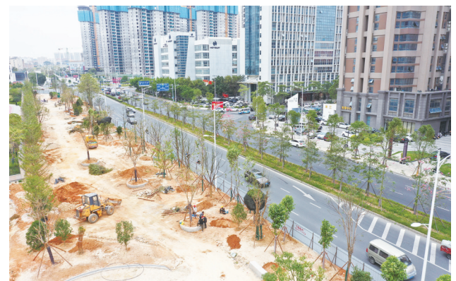
在完成管网预埋、园路下部基础等的施工后,石龙路运动休闲公园项目开始大范围绿化。预计今年年底,大家就可以看到一个新的街边运动休闲公园。(记者康清辉 颜华杰)