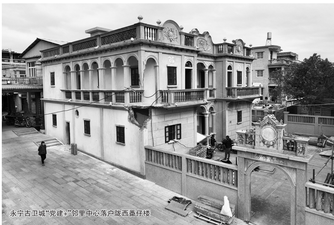
永宁古卫城“党建+”邻里中心落户陇西番仔楼

疏导困境儿童265人次；筹集助学金和慰问物资超过18万元。今年一笔3.5万元的基金，将用于困境家庭的助学、助医、助困。 古卫城的半边井与城隍庙的景区网格员入驻“党建+”邻里中心后，就地取材，用这些耳熟能详的家风家训，巧妙化解小矛盾。 除此，近邻纪检工作室、“两代表一委员”工作室等职能单位也下沉“党建+”邻里中心，激活引擎、服务民众；还有书香永宁、口述永宁等有声图书馆；母婴室、儿童之家、卫生健康服务站等关爱游客健康和隐私的服务室，均体贴周到地布置进邻里中心，一站式关爱到“家”。(记者 洪亚男 李荣鑫)