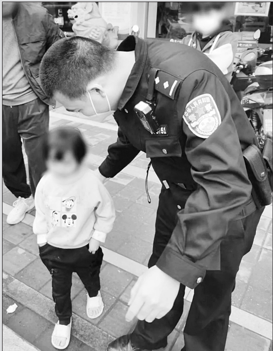
女孩独自外出迷路 “临时奶爸”来帮忙