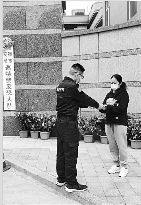
外籍人员钱包丢失 民警快速帮助寻回

12月17日14时许,热心市民向灵秀派出所报警求助,金相路有一小女孩衣着单薄,独自站在路边号啕大哭。民警立即出警到现场,一边耐心安抚小女孩,一边耐心询问其个人信息。小女孩年纪小,说不清家庭住址,也不知道父母的电话号码。由于室外气温低,民警决定先将