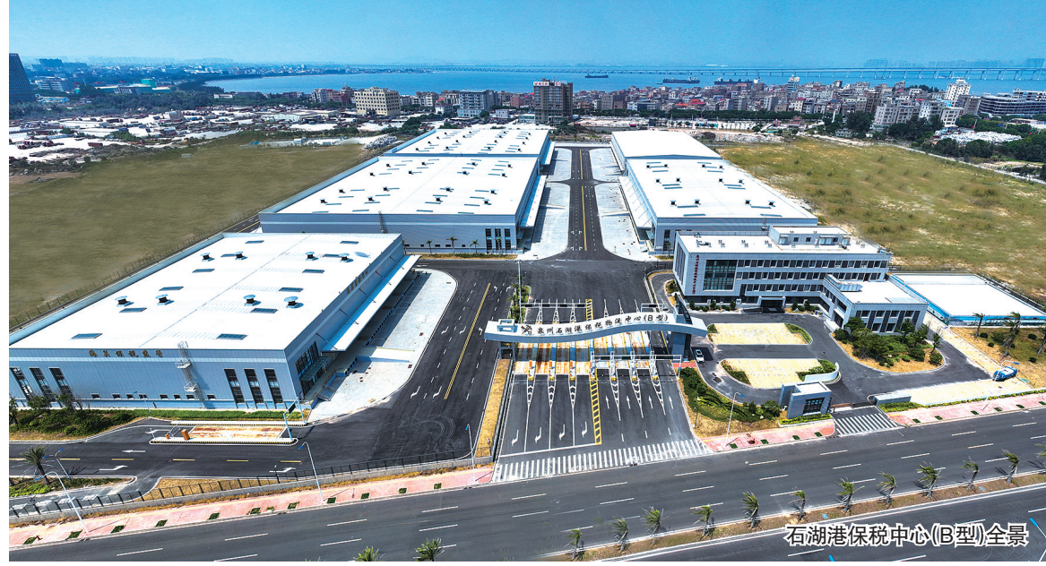
石湖港保税中心(B型)全景

发展总是与开放相伴相生。三面环海的石狮，因改革开放而生，由商贸繁荣而兴。在波澜壮阔的改革开放进程中，作为外向型经济高度发达的城市，石狮始终坚持以“开放”理念拓展发展格局，积极融入“双循环”，依托独特的区位优势，着力搭建开放大平台，打通物流大通道，培育外贸新主体，推进高水平对外开放。 不断“出海”，只为“领航”；不断“更新”，只为“创新”。近年来，石狮针对国内外疫情和国际形势等导致的汇率波动、企业抗风险能力削弱、资金周转困难等痛点、难点、堵点，主动创新破局，推出汇率避险“公共保证金池”、灵活运用市场采购贸易新业态跨境收汇“总量核销”优势、创新“数据贷”“增信信保贷”“退税快贷”外贸金融产品、推行出口信保服务外贸市场主体，持续增强外贸活力与韧性，稳住出口基本盘；积极促进外贸提质增效的新机制，加快体制机制创新，化“危”为“机”，开展中非、拉美等12场“小石狮”大世界“跨境电商贸易方式试点，全国唯一的预包装食品出口试点，享有