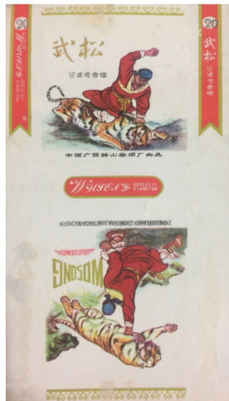
中国广西钟山卷烟厂出品武松烟标

成787×1092开幅初版本年画在全国发行。这幅定格于嫦娥回头张望人间的情景：她身着一袭粉红色带蓝色的披风，头插鲜花发髻高绾，怀抱温顺纯洁的白兔，手提花灯，脚踏祥云衣袂飘飘的形象。她那略带忧伤，仿佛遥望思念着地上亲人的神色，不由使人想到北宋文学家苏轼《水调歌头·丙辰中秋》中“起舞弄清影，何似在人间”的词句。由于我国民间传说月中有一座金碧辉煌的广寒宫，里面居住有太阳星君、月神、月光娘娘、吴刚、嫦娥、玉兔，因而年画背景金黄色圆月中突出了琼楼玉宇群落。上世纪80年代，陕西延安卷烟厂出品的“嫦娥”烟标，副版上的嫦娥奔月画面就来源于金梅生的这幅《嫦娥奔月》，只不过烟标上的画面去掉了祥云，月亮中的琼楼玉宇也只能看到一处，同时嫦娥的面部表情与衣着、飘带，还有玉兔、玉佩尽管与年画着色有所不同，不过把两者放在一起仔细对比，可以发现这枚烟标副版图案确实源于金梅生的《嫦娥奔月》年画。 水浒鲁提辖拳打镇关西也是年画经典，辽宁美术出版社曾于1992年8月出版发行《鲁提辖拳打镇关西》年画，这幅一套两张、一版一印的年画，系由源华、板岩、可泉、木子绘编，共十二个画面，精彩地描绘出恶霸镇关西被鲁智深打死的全过程。上世纪90年代，中国淮阴卷烟厂出品的“武状元”烟标，主副版图案鲁智深踢飞镇关西、鲁提辖痛打镇关西的画面，就来源于这幅年画。