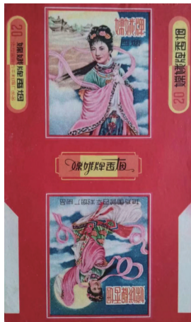
地方国营四平制烟厂出品金梅生嫦娥奔月国画版嫦娥烟标

■山西大同 李润 春节贴年画是我国传统的民俗。因张贴于室内一年一换而得名的年画，起源于古代的门神，唐宋时期演变为木板年画，明清开始盛行于全国各地，随着社会经济的发展，过去常贴在室内墙上的年画逐渐被挂历等各类墙画取代。金梅生、顾炳鑫、华三川、刘旦宅、张令涛、胡若佛、刘王斌等我国现当代著名画家，都曾创作过人们喜闻乐见的民间故事或戏曲故事，切近时代的现代题材年画。笔者在此仅说说脱胎于金梅生年画的烟标。 金梅生(1902—1989)，上海人，别名石摩，1919年师从余泳青学习水彩画，1920年考入商务印书馆美术科专门从事月份牌的绘画，1930年成立自己的画室，致力于创作月份牌画，近50年将毕生事业献给了中国商业广告艺术，擅长画古装戏曲美女，他吸收了中国画与西画的精髓，与谢之光、杭稚英一起将中国月份牌画推向一个更深的层次。1949年后成为中国美术家协会理事，1956年受聘于上海画片社。1962年聘为上海市文史馆馆员、上海人民美术出版社特约年画家。其代表作主要有：《梁山伯与祝英台》《木兰从军》