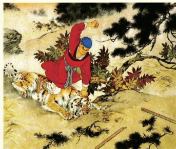
人民美术出版社1957年一版一印刘继卣《武松打虎》连环画之十四