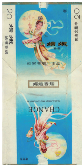
陕西延安卷烟厂出品嫦娥烟标