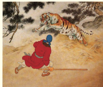
人民美术出版社1957年一版一印刘继卣《武松打虎》连环画之十