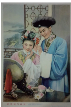
金梅生创作的《白娘子与许仙》年画