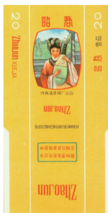
河南温县烟厂出品昭君烟标