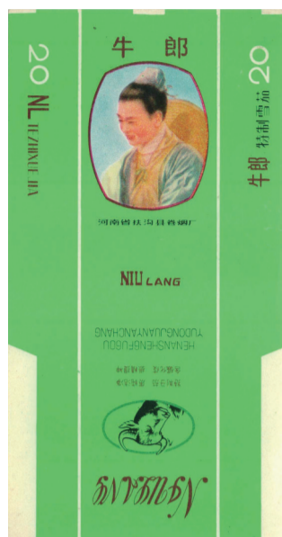
河南省扶沟县卷烟厂出品牛郎烟标