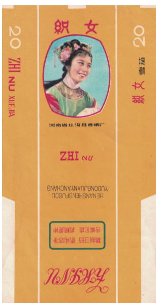
河南省扶沟县卷烟厂出品织女烟标