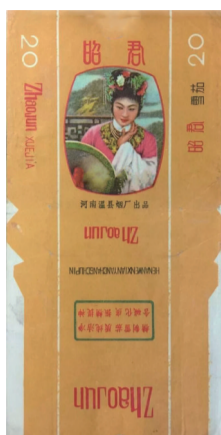
河南温县烟厂出品昭君烟标