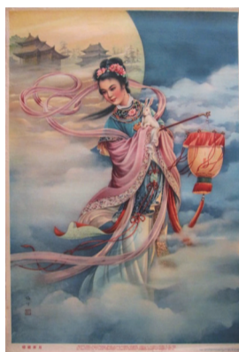
金梅生创作的《嫦娥奔月》年画