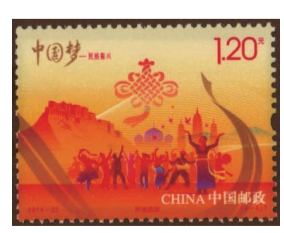
图5《中国梦(二)——民族振兴》特种邮票之“民族团结”