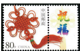
图2《同心结》个性化服务专用邮票