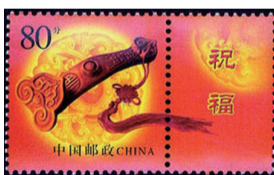
图1《如意》个性化服务专用邮票

中国香港邮政于2019年10月1日发行《中华人民共和国成立七十周年》特别邮票(图8),该套邮票造型别致,设计单枚为三角形,四枚可组合成一个菱形,拼出精巧的“中国结”图案。邮票图案还融合了国旗、舞龙等元素,具有浓浓的节日气氛,寓意团结、吉祥、和谐。