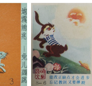
图11“地震前兆——兔儿蹦跳”火花