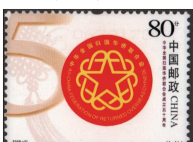
图3《中华全国归国华侨联合会成立五十周年》纪念邮票