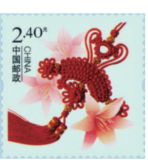
图4《美好祝福》贺卡专用邮票