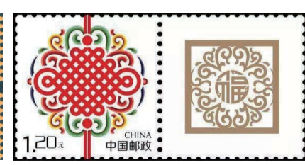
图7《中国结》个性化服务专用邮票