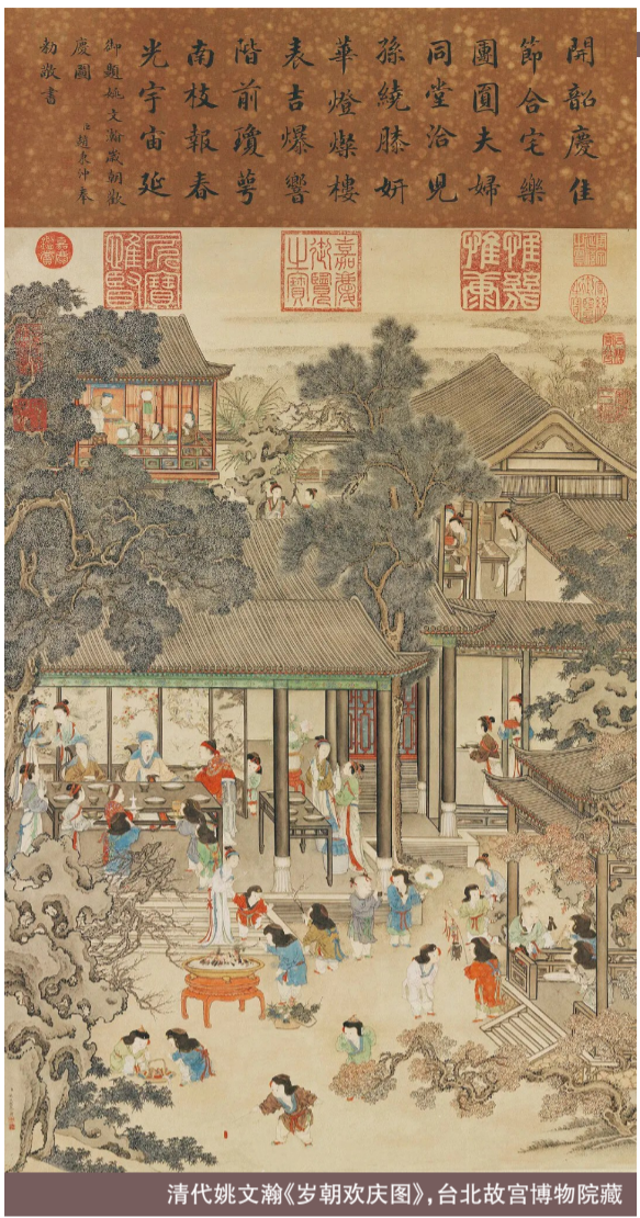
清代姚文瀚《岁朝欢庆图》,台北故宫博物院藏