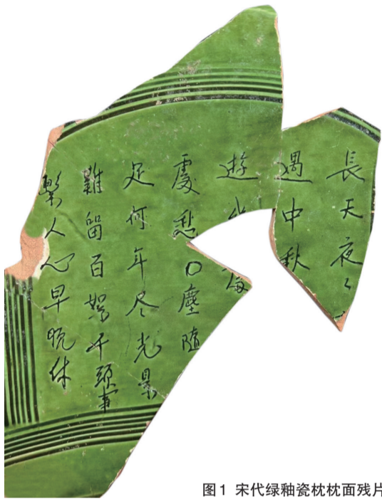
图1 宋代绿釉瓷枕枕面残片