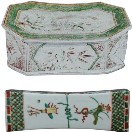
图3 古瓷枕上彩釉绘精美图画(一组)

诗枕,在宋瓷中有着极为特殊的地位,它以有限的画面诗句,记录了宋人的诗意生活,体现了宋人身心放松、与世无争的心态。从这些诗枕中,我们看到了古人在枕头上的迁想,他们一定觉得,枕上有诗,是最风雅的事,睡在这种瓷枕上,就是高枕无忧、诗书美梦了。