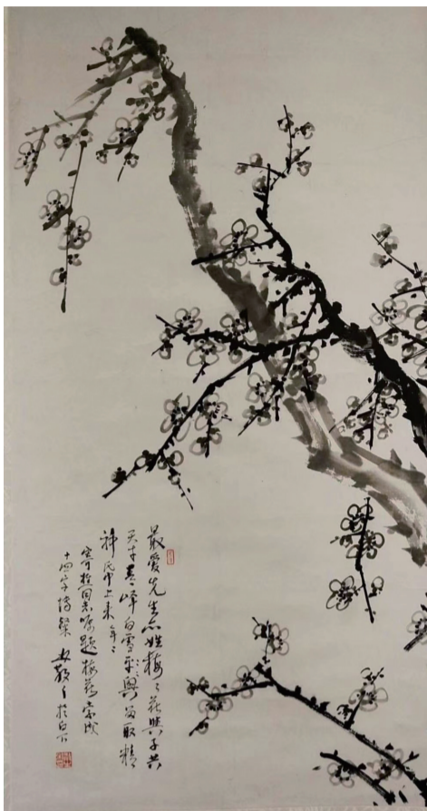
梅雪峰《梅花图》立轴(1972年)

但是“林散之于白下”这种款,在林老作品中实不多见。题款中的“白下”,系南京的古称,很显然,此题词是林老在南京书写。那么是何年呢?我想可能是在1972年11月8日,林老因病由大儿子林昌午送来南京,住在“美术创作组”临时所在地——申家巷46号(江苏省戏剧学校)这段时间所题。林老在此住了一个月,一是因坐骨神经痛来宁就医,二是与“美术创作组”和南京艺术学院商谈是否来南艺教授书法之事。来时即写信给冯仲华,约冯仲华、尉天池等人有空来玩(笔者注:信上注明了来宁的日期和住址),也许就在此时,胡寄樵持梅雪峰《梅花图》立轴来请林老题字,因申家巷46号靠近太平巷,又离杨公井不远,属于白下区,故林老落款“林散之于白下”。