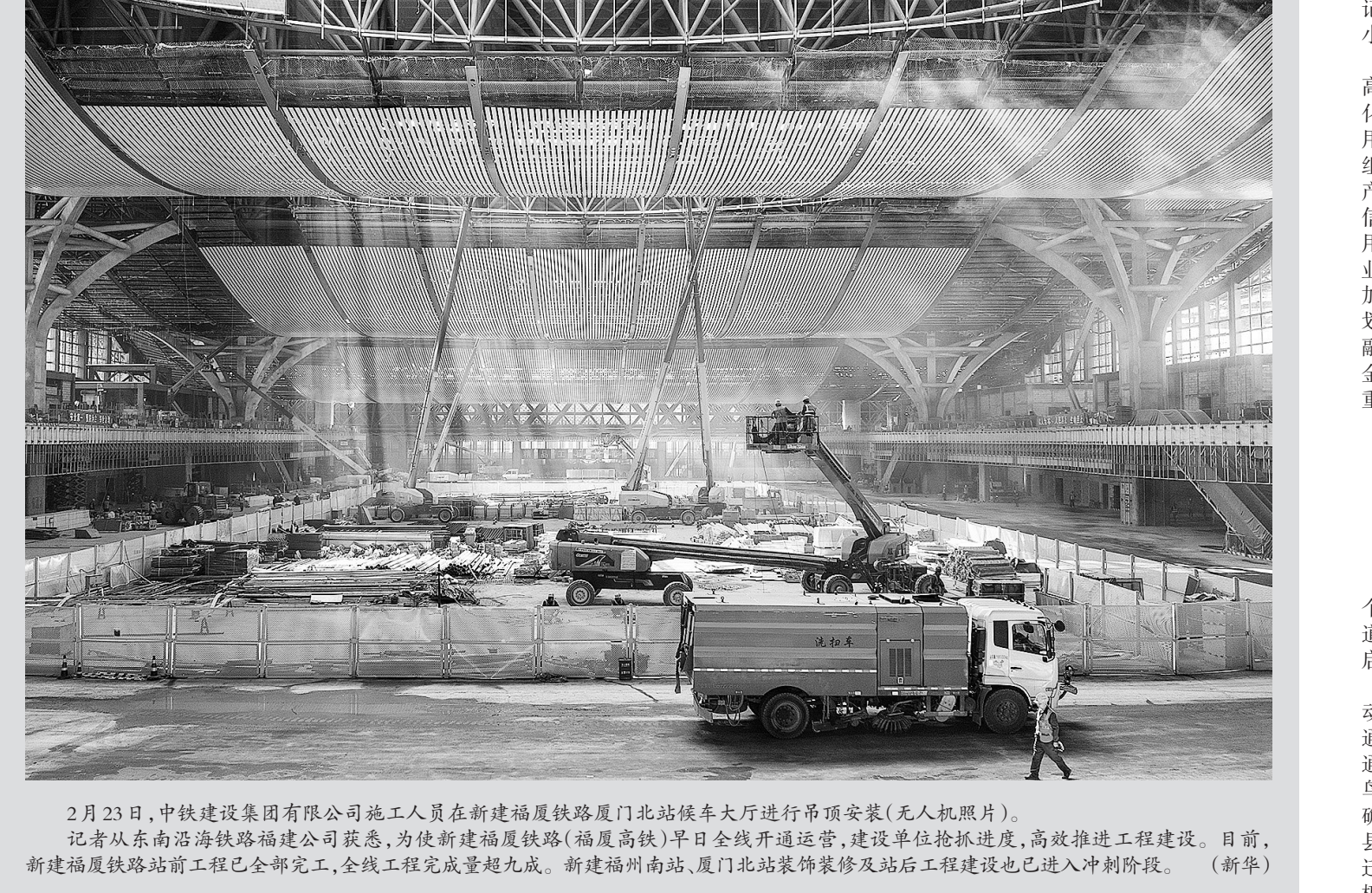
2月23日,中铁建设集团有限公司施工人员在新建福厦铁路厦门北站候车大厅进行吊顶安装(无人机照片)。记者从东南沿海铁路福建公司获悉,为使新建福厦铁路(福厦高铁)早日全线开通运营,建设单位抢抓进度,高效推进工程建设。目前,新建福厦铁路站前工程已全部完工,全线工程完成量超九成。新建福州南站、厦门北站装饰装修及站后工程建设也已进入冲刺阶段。