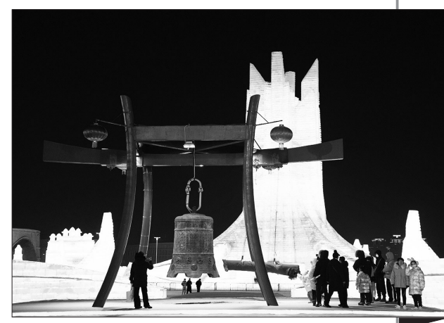
▲哈尔滨冰雪大世界接待游客80余万人次 2月25日，游客在哈尔滨冰雪大世界园区游玩。2月25日22时，第24届哈尔滨冰雪大世界正式闭园。本届哈尔滨冰雪大世界自2022年12月17日开园迎客以来，共计营业71天，接待游客数量达80余万人次。

新华社北京2月26日电 记者从中国中铁股份有限公司获悉，雄安新区至忻州高速铁路(雄忻高铁)新盖房特大桥建设日前正式动工，标志着雄忻高铁雄保段全面进入主体施工阶段。 据中国中铁电气化局雄忻高铁项目负责人麻建华介绍，雄忻高铁是我国“八纵八横”高速铁路网京昆通道的重要组成部分，线路东起京雄城际铁路雄安站，向西经雄安新区、河北省保定市，到达山西省忻州市，正线全长342公里，设计时速350公里。 此次施工的新盖房特大桥全长4304米，是这条线路的重难点和控制性工程，预计2024年可以实现大桥主体全部完工。