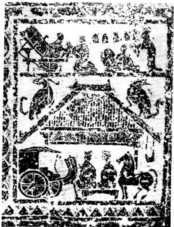
图1 纺纱织布画像石

从画面中可知,徐州汉代人的农耕业发达,人们能够吃上谷物烹煮的饭,并且也从事渔猎采集的劳动,能吃上鱼肉,甚至发展了养殖业,饲养了马与羊等动物。虽然雕刻略显粗糙,画面整体显得较为拥挤,但仍透出浓厚的生活气息,呈现出一种热情、喜悦与富足的生活状态。汉乐府中“努力加餐饭”的质朴歌谣就从这种生活中诞生,将汉代人最朴素的愿望久久传唱。