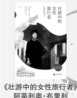
《壮游中的女性旅行者》 阿蒂利奥·布里利

“壮游”是将观光和研学、游历结合在一起的一种长途旅行。本书以女性旅行者为主角,讲述了1757至1854年间16位杰出女性的旅行故事。她们在旅行中创作了丰富细腻的旅行日志和文学艺术作品,在文化史上留下属于女性的别样精彩。