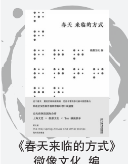
《春天来临的方式》 微像文化 编

《春天来临的方式》是一场幻想小说盛宴,呈现丰富而多元的中国想象力。该书收录15位幻想文学代表作家的作品,英文版在海外同步推出,作者、编辑、译者、设计师为全女性创作者阵容,是中国幻想文学走出去的一次精彩亮相。