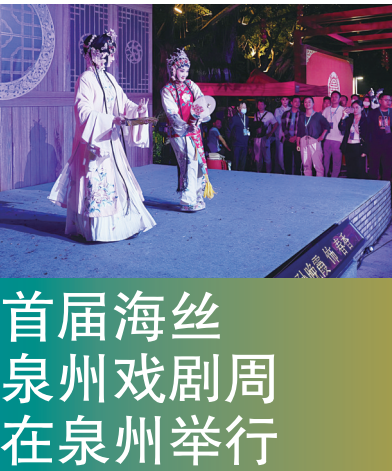
首届海丝泉州戏剧周在泉州举行

由中国艺术研究院、中国戏剧家协会、福建省文化和旅游厅、福建省文学艺术界联合会、泉州市人民政府主办的首届海丝泉州戏剧周——2023年全国南戏展演活动，4月27日至5月3日在泉州隆重举行。