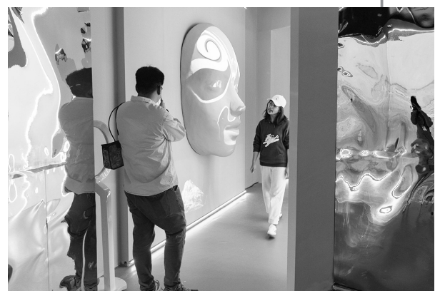
▲首届东北亚文化艺术创意设计博览会启幕 5月7日,在哈尔滨国际会展体育中心,观众在首届东北亚文化艺术创意设计博览会上参观拍照。当日,首届东北亚文化艺术创意设计博览会在哈尔滨国际会展体育中心启幕。本届博览会为期4天,来自全国各地300余家政府团组、文化机构和企业与俄罗斯、法国、巴西等10余个国家和地区的30余家文化机构、企业参展。