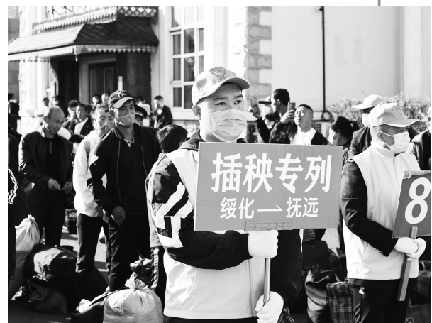
▲“大粮仓”黑龙江省连续24年开行“插秧专列” 在绥化火车站站前广场,志愿者们组织乘客等候K5151次列车(5月6日摄)。5月6日17时,K5151次列车从黑龙江绥化站出发,来自绥化等地的400余名“插秧客”乘坐专列,奔赴三江平原进行春耕生产工作。每年春耕季,绥化地区都有大批“插秧客”前往三江平原从事春耕生产。据介绍,黑龙江今年约有5万名务农人员乘坐专列前往垦区插秧,铁路部门在图定列车基础上,增开“插秧专列”,沿途覆盖三江平原大部分农场。自哈尔滨铁路部门2000年首次开行“插秧专列”以来,已连续24年累计服务务农旅客超180万人次。(新华社)

占比达61.93%,较2021年增长迅猛。中国健美协会主席张海峰表示,希望健身同仁们能够通过行业报告了解健身行业状况,探索未来发展趋势,携手同心、坚定信心,把握发展机遇,为实现建成体育强国的目标而共同努力奋斗。(新华社)