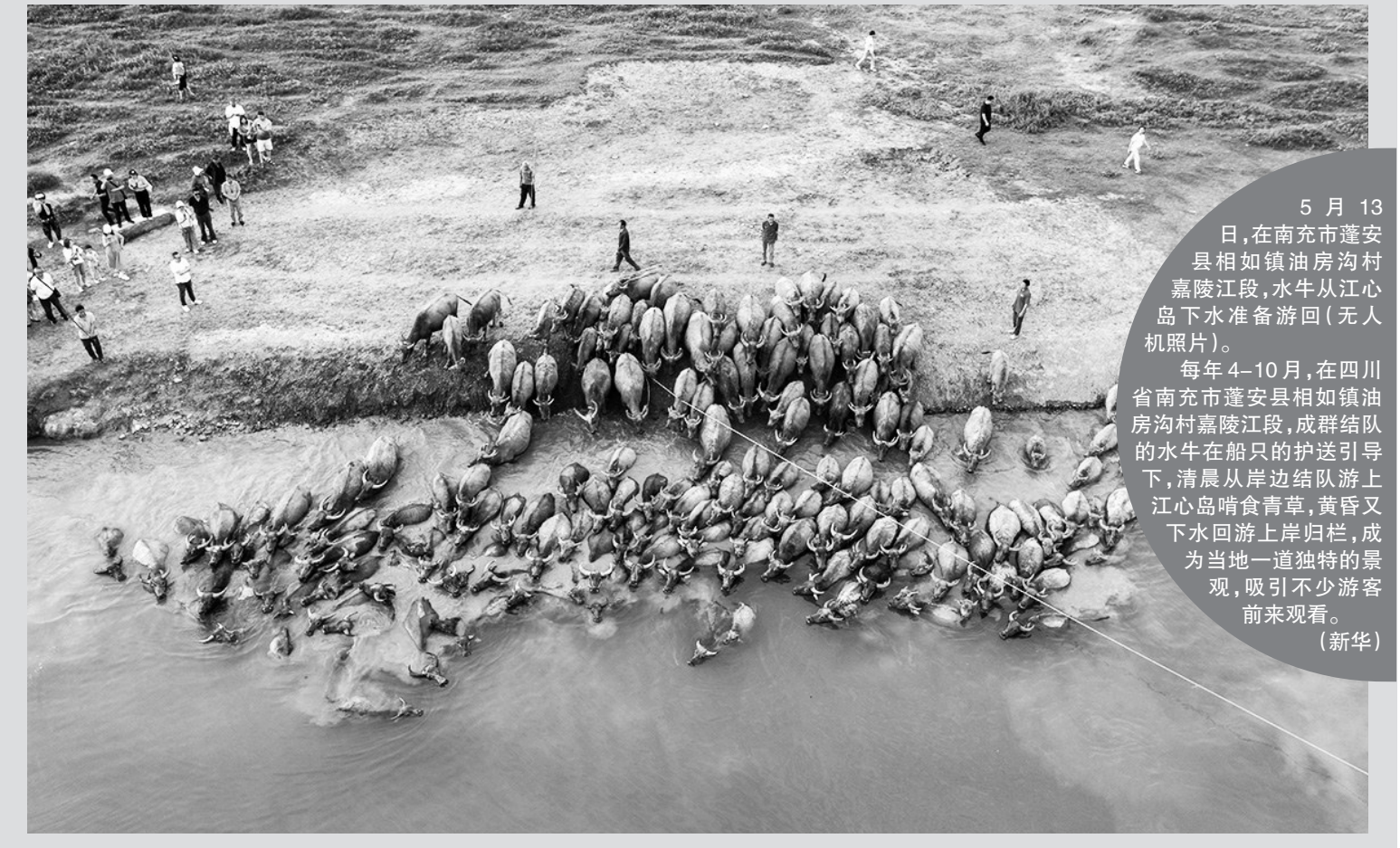
5月13日，在南充市蓬安县相如镇油房沟村嘉陵江段，水牛从江心岛下水准备游回(无人机照片)。 每年4-10月，在四川省南充市蓬安县相如镇油房沟村嘉陵江段，成群结队的水牛在船只的护送引导下，清晨从岸边结队游上江心岛啃食青草，黄昏又下水回游上岸归栏，成为当地一道独特的景观，吸引不少游客前来观看。