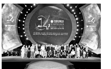
第十四届华语科幻星云奖13日晚在四川广汉三星堆揭晓。 据了解，华语科幻星云奖是由华人科幻志愿者于2010年创立的公益性科幻奖项，致力于在全球范围内发现和奖励优秀华语科幻作品、作者和相关从业者。经过多年发展，该奖项已成为华语科幻文学领域的权威奖项，推出了上百名成梯次的中国优秀科幻作家。 (新华)

“5·15”全国公安机关打击和防范经济犯罪宣传日前夕，记者从北京市公安局经侦总队了解到，北京警方近期在线索摸排中发现多家“投资公司”以招聘外汇期货交易员及操盘手的名义开展非法经营活动、骗取应聘人员钱财。在查明案件事实基础上，警方牵动相关单位打掉犯罪团伙6个，刑事拘留犯罪嫌疑人51人，涉案金额近4亿元。 北京市公安局经侦总队八支队政委周岩介绍，上述“公司”多开在高档写字楼内，装修精良，刻意营造专业金融机构假象，但实质并无任何经营项目。 北京警方提醒，未取得从事外汇、期货交易资质的公司，组织投资者从事证券、期货交易的行为涉嫌非法经营犯罪。面对招聘信息，应充分考察用人单位背景，切勿轻信不实宣传，造成财产损失。 (新华)