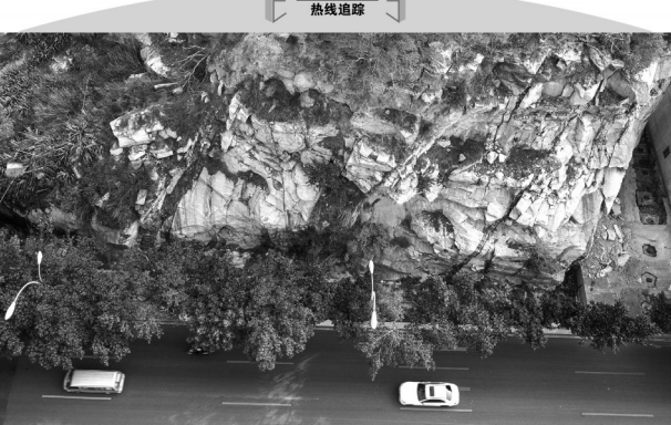
2021年3月19日《石狮日报》报道