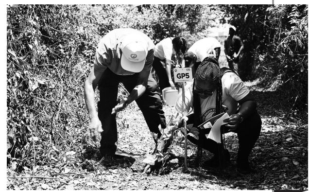
▲加纳开展植树活动迎接“绿色加纳日” 6月9日，志愿者在加纳首都阿克拉市区一片林地栽种树苗。6月9日是今年的“绿色加纳日”，加纳在全国范围开展植树活动，吸引众多民众参与。

杜伊斯堡市1987年举办德国首个赛龙舟活动。自2000年以来，杜伊斯堡市每年6月都要在当地地标性的内港举行一场盛大的趣味龙舟赛。杜伊斯堡市是“一带一路”在欧洲西部的重要支点、中欧班列的重要节点。