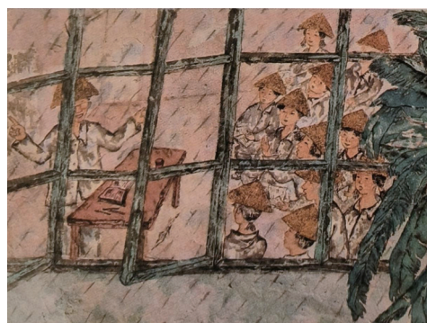
3.学校房屋简陋不堪,遇上下雨天,师生只得戴斗笠上课。