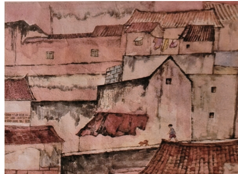
2.时隔多年后再次回乡,一路上家乡的贫瘠样貌让他心情沉重。