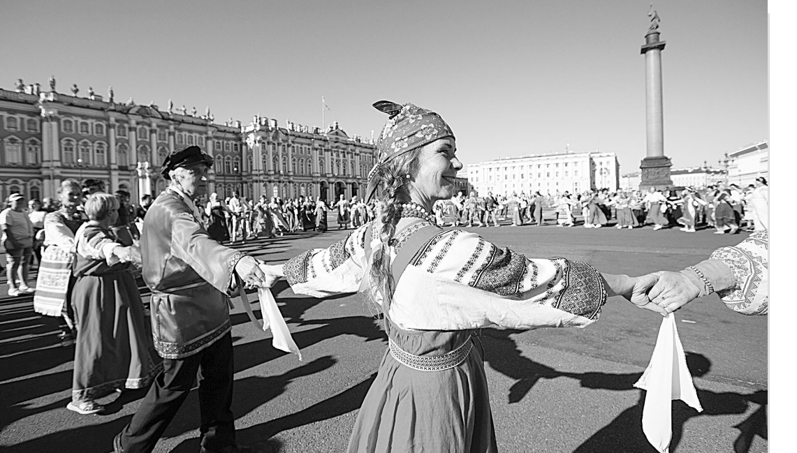
▲夏日圆舞曲 8月15日, 民众在俄罗斯圣彼得堡冬宫广场跳圆舞曲。第七届“俄罗斯圆舞曲”国际艺术节15日在俄罗斯和独联体国家上百座城市举行, 其中主场在俄罗斯第二大城市圣彼得堡。当天傍晚, 数千人聚集到圣彼得堡冬宫广场, 手拉手围成圆圈起舞。