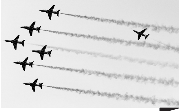
▲马耳他举行国际航空展 9月23日，在马耳他布吉巴，飞机在国际航空展上进行飞行表演。马耳他国际航空展于23日至24日举行，精彩的特技飞行表演吸引了大量观众。

新华社合肥9月24日电 为进一步推动种业振兴，我国将加快推进挖掘优异种质资源、种业创新攻关、做强国家种业阵型企业、提升种业基地能力和知识产权保护“五大行动”。 在挖掘优异种质资源方面，全面开展国家库(圃)种质资源精准鉴定，组织农作物种质资源登记，发布可供利用的农业种质资源目录，夯实育种创新资源基础。 在推进种业创新攻关方面，以推动大面积单产提升为方向，统筹推进多层次育种创新联合攻 关，加快选育一批高油高产大豆、短生育期油菜、耐盐碱作物等急需的突破性品种。 在做强国家种业阵型企业方面，健全精准扶持优势企业发展的政策，强化“一对一”帮扶机制，加快培育一批航母型领军企业、“隐形冠军”企业和专业化平台企业。 在提升种业基地能力方面，深入推进南繁硅谷、甘肃玉米、四川水稻、黑龙江大豆、北京畜禽等育种制种基地建设，力争到2025年国家种业基地供种保障率达到80%。 在知识产权保护方面，实施品种身份证管理，建立全链条全流程监管机制，严厉打击假冒伪劣、套牌侵权等违法行为，持续优化种业市场环境。 据了解，本届“双交会”以“稳粮保供强根基、聚力振兴谱新篇”为主题，由全国农业技术推广服务中心、农业农村部农业贸易促进中心、中国种子协会、安徽省农业产业厅和中国合肥市人民政府共同主办。