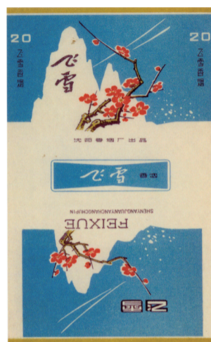
图3 20世纪50年代飞雪烟标