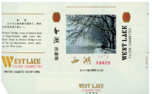
图9 20世纪80年代西湖套标·断桥残雪