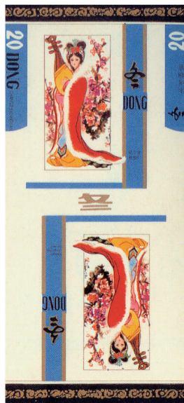
图12 20世纪80年代四季套标·冬