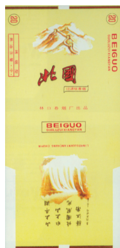
图4 20世纪80年代北国烟标

祥所作《咏召陵》七绝“彤云散尽晓天晴,白雪皎如牛耳盟。假使苞茅不问楚,而今谁识召陵城”。而河北石家庄卷烟厂出品的“热河”套标(图6)中,有一枚主版描绘的是河北承德避暑山庄“康熙三十六景”之第十三景——南山积雪的美景:只见白雪皑皑的僧帽峰上,十分醒目地显露出几株被白雪覆盖的青松。副版则用行草书录有康熙的《南山积雪》七绝诗句:“图画难成丘壑容,浓妆淡抹耐寒松。水心冰骨依然在,不改冰霜积雪冬。”其它诸如寒江雪柳、梁园雪霁、断桥残雪、石城霁雪、远眺雪山等不少因雪而成名的著名景点,也不时在烟标上有所体现。如为配合1991年吉林市首届雾凇节,四平卷烟厂与吉林市烟草公司合作出品有多种版别“雾凇”烟标(图7),其主副版图案大多数表现的是我国四大自然奇观中唯一的季节性景观——神奇、纯洁、瑰丽的雾凇美景画面,同时有的烟标还于侧标位置印有当年江泽民总书记视察吉林期间,饱览雾凇风采时写下的题词“寒江雪柳 玉树琼花 吉林树挂 名不虚传”字样。更多的雪景则多见于成套烟标,其烟标在描绘雪景的同时,还印有相关的介绍文字。如