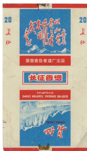
图2 20世纪60年代长征烟标

此外,尚有许多充满诗情画意的瑞雪与风景名胜相映成趣的烟标。如漯河卷烟厂出品的“雪城”烟标(图5),其主版图案则描绘了位于漯河市召陵镇银装素裹的召陵雪霁美景,同时于其右侧标位置对之作有说明:“‘雪城’为中州古邑召陵之别称。从前,晴朗的夏夜,曾多次出现瑞雪笼罩的幻境,郾城八景之一。雪城地灵人杰,孕育出许慎等古今名人,所产烟草,金黄油润,香味纯正,是配制高档卷烟的上乘原料。”烟标副版则用行草书印有明代诗人杨元