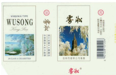
图7 20世纪90年代雾凇烟标