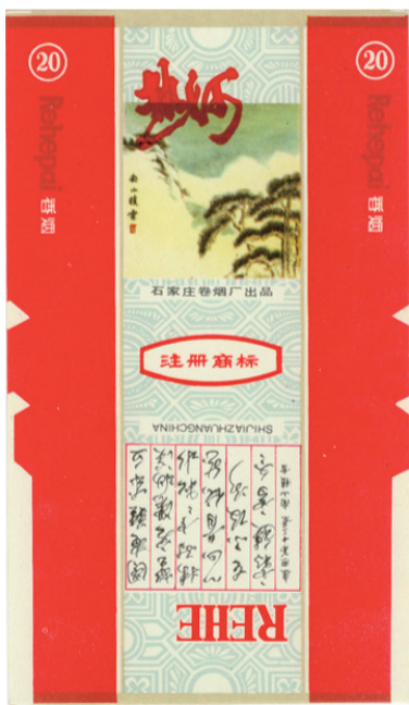
图6 20世纪80年代热河套标·南山积雪烟标

一枚(图11)烟标于副版描绘了位列峨眉十景之一的远眺雪山美景,烟标在渲染白雪覆盖、层次分明的雪山苍茫景色的同时,不忘对之予以介绍“峨眉山顶的气温很低,一到冬季,峨眉山顶成了一个白茫茫的洁净世界,群山丛林,如精雕玉琢,置身于此景,无不心旷神怡”。赏雪胜地再美如果没有人去欣赏也就称不上美景了,或许源于此,哈尔滨卷烟厂在其出品的一枚冬烟标(图12),主版在盛开于雪地上的红梅背景衬托下,描绘了一位美女身着裘衣,正手抱琵琶赏雪的画面。