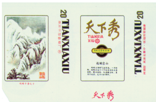
图11 20世纪80年代十枚套天下秀烟标·远眺雪山