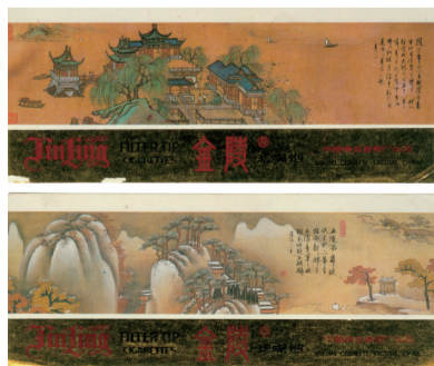
图10 20世纪80年代金陵听标