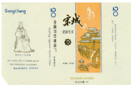
图8 20世纪80年代宋城套标·梁园雪霁