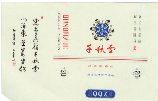
图1 20世纪80年代千秋雪烟标