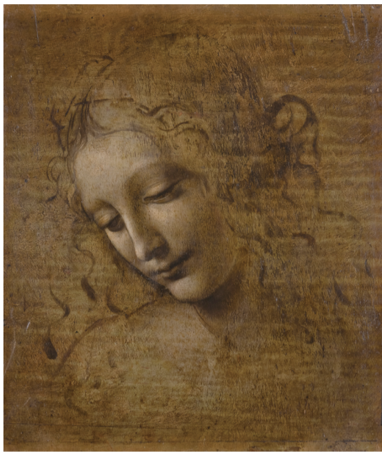
列奥纳多·达·芬奇《头发飘逸的女子》，帕尔马国家美术馆藏