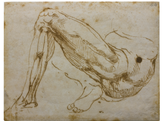
米开朗基罗·博那罗蒂素描《腿》，佛罗伦萨博那罗蒂之家藏

本报讯 近日，由上海博物馆和意大利特雷卡尼百科全书研究院联合主办的“对话达·芬奇——文艺复兴与东方美学艺术特展”亮相上海博物馆人民广场馆展厅。据悉，此次展览是上海博物馆首次打造的东西方绘画艺术对比展，也是中国迄今为止最强阵容的达·芬奇作品真迹展，共展出达·芬奇领衔的18幅西方艺术珍品和18幅中国古代绘画传世名作。