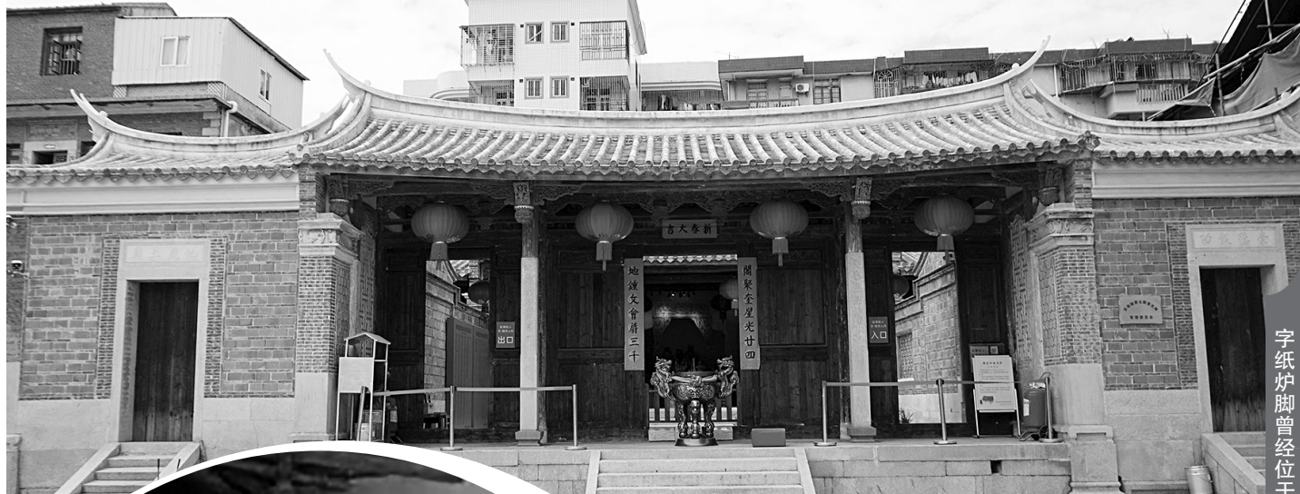
字纸炉脚曾经位于的地方