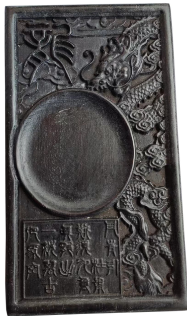
图2 清代“龙”字款长方形檀木砚

清代黄花梨木砚(图3),长30.5、宽15.5、厚2.5厘米。砚正面中央为大面积随形砚堂,砚堂分两层,下层砚堂深雕成山字形,作磨墨用;上层浅雕,作笔捺