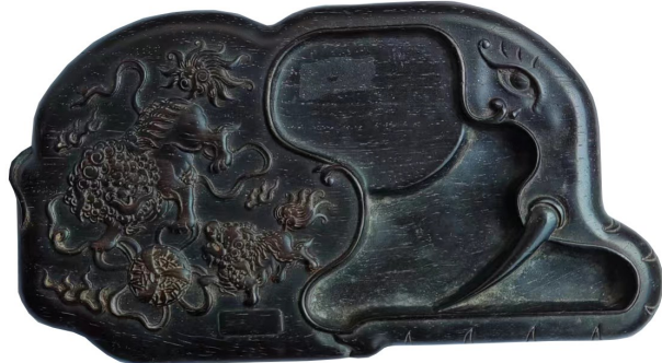
图4 清代象形檀木砚