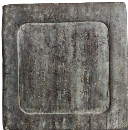
图1 清代“映雪堂”款四方形檀木砚