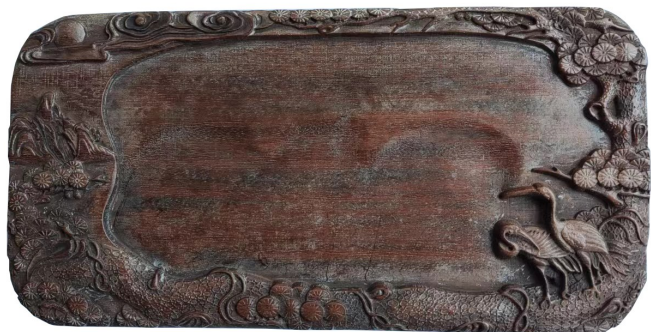
图3 清代黄花梨木砚

清代象形檀木砚(图4),长20.5、宽11.5、厚1.8厘米。砚面似一只躺着的大象,以象耳与张开的象嘴及象牙作砚堂,共分三层,象耳浅雕为上层砚堂,象嘴与象牙深雕为中下层砚堂,以象牙巧妙作自然分隔层。既可磨墨,又可作笔捺,还可作小水盂。砚堂右侧雕刻象眼、象牙和象鼻,活灵活现。砚堂左侧象身体后部分阳雕太狮和少狮戏绣球场景。砚的最后侧还雕有一条极富动感的象尾巴,让整件作品尽显灵动。