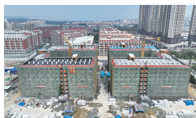
泉州海洋职业学院东南校区建设项目一期建设有序推进。据悉,该项目一期主要包括两栋学生公寓以及相关配套工程,计划于7月份竣工交付。 (记者 邱玉清 李荣鑫)