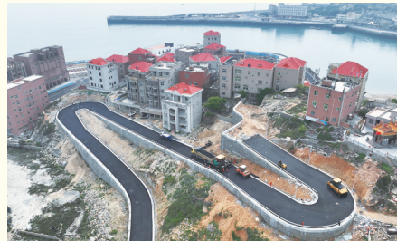
近日,祥芝滨海界面提升工程的子工程——盘山景观路工程开始沥青铺设。伴随着机器的阵阵轰鸣和人工细致处理,干净整齐的沥青路整体呈现,渔村风貌颜值再提升! (记者 王文豪 李荣鑫)