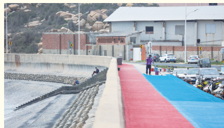
近日,记者在国道228线石狮段的鸿山东埔段看到,施工人员继续对已建成的堤岸上的行道涂刷蓝色面层,让这条彩色慢道继续“延长”。 (记者 康清辉 颜华杰)