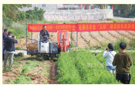
3月27日,福建省农机推广总站、泉州市农机发展中心联合石狮市农业农村局在石狮举办胡萝卜机械化采收试验现场会,邀请泉州、石狮、晋江等地的各大农业种植户等到场观摩。 (记者 林富榕 颜华杰)