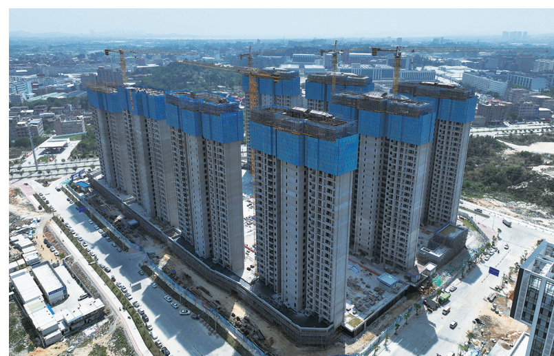
作为石狮网商园的重要人才社区配套,近日,随着3号楼完成屋面层楼板混凝土的浇筑,国投·狮城领秀项目8栋高层住宅楼全部完成主体封顶,比原计划工期提早近两个月。项目预计2025年春节前全面完工,届时可提供792套户型在94㎡—142㎡的住宅。 (记者 康清辉 李荣鑫)