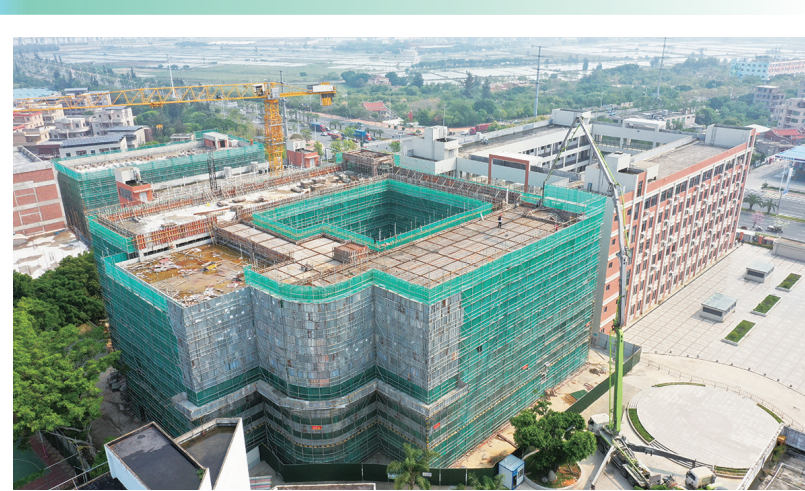
4月3日,蚶江中学扩建(二期)项目的一栋六层的高中教学楼主体封顶,转入砌体和内外装修施工。此前,该项目一栋六层的学生公寓已在1月中旬率先封顶,目前砌体施工也进入尾声,整个项目主体力争在9月底前完工。项目建成后,高中教学楼可新增30间教室,并改善学生住宿环境,持续提升学校的整体办学条件。 (记者 康清辉 颜华杰)

日前,《石狮市关于招引专精特新中小企业若干措施》出台,将从大力招引专精特新企业、支持企业入驻标准化园区、降低企业项目用地成本、支持企业购置新设备、强化金融信贷支持、加强企业人才支撑、支持专精特新企业在石认定、加强资源要素保障等八方面,加大对专精特新中小企业招引力度,做大做强专精特新增量,提升专精特新企业招引力度和服务保障力度,实现专精特新和“小巨人”企业招得来、留得住、快发展,增强我市产业发展的连续性和竞争力。 (记者 许小雄)