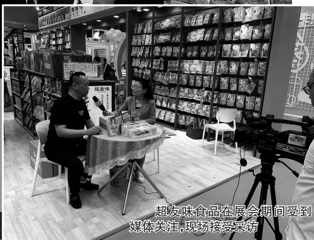
超风味食品在展会期间受到媒体关注,现场接受采访