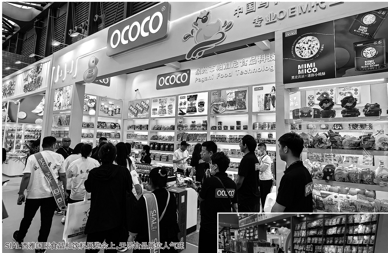
SIAL西雅国际食品和饮料展览会上,天乐食品展位人气旺