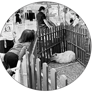
本报讯“五一”假期,商场成为市民休闲娱乐的热门选择。石狮世茂商城另辟蹊径,将“动物园”搬进商场,为广大群众带来一场别开生面的互动体验。

5月3日晚,走进萌宠乐园活动区,可爱的水豚悠闲地“营业”,凭借松弛的神态迅速成为焦点,吸引众多市民排队打卡合影。毛茸茸的兔子乖巧温顺,小朋友在工作人员的指导下,轻轻抚摸兔子,脸上洋溢着纯真的笑容。