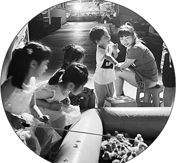
大饱口福,也为石狮的假日经济注入新的活力。(记者 张军璞)