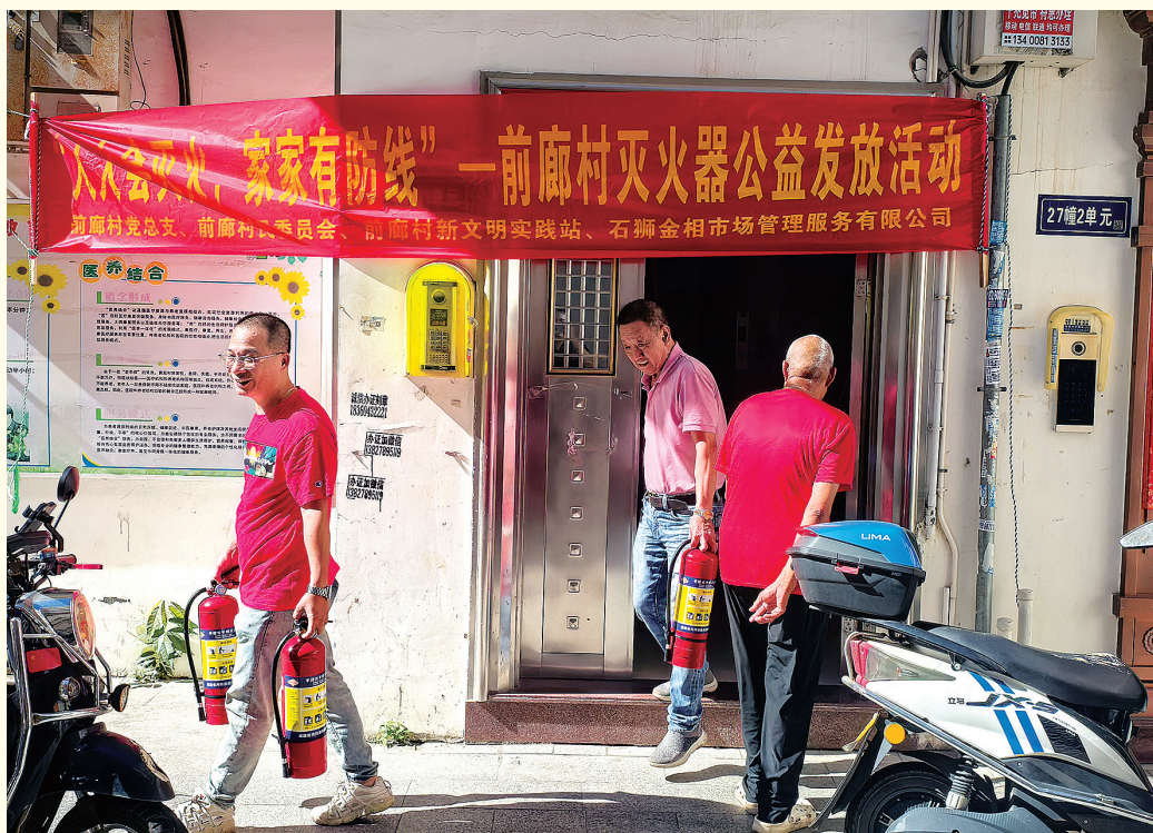
“人人会灭火，家家有防线”——前廊村灭火器公益发放活动

为更好保障人民群众生命财产安全，提升村民的消防安全意识，石狮金相市场管理服务有限责任公司统一采购了一批家用灭火器，并按照“一户一具”的标准，免费发放给本村原始户籍家庭。(记者 康清辉)