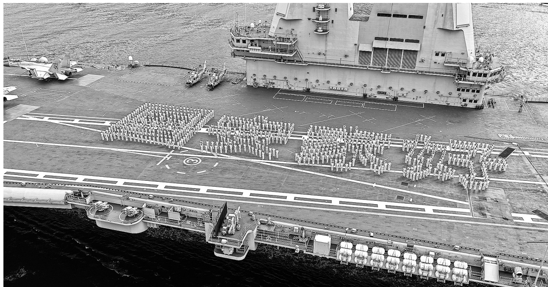
▲海军山东舰航母编队抵达香港 7月3日,中国海军山东舰航母编队抵达香港。这是山东舰官兵在飞行甲板上列队排出“国安家好”字样(无人机照片)。在香港回归祖国28周年之际,由中国人民解放军海军航空母舰山东舰,导弹驱逐舰延安舰、湛江舰及导弹护卫舰运城舰组成的航母编队,携多型舰载战斗机、直升机和陆战队队员,于3日上午抵达香港特别行政区,开启为期5天的访问活动。

船事故已造成6人遇难,24人失踪,另有35人获救。搜救行动因夜幕降临暂时结束,将于4日继续进行。