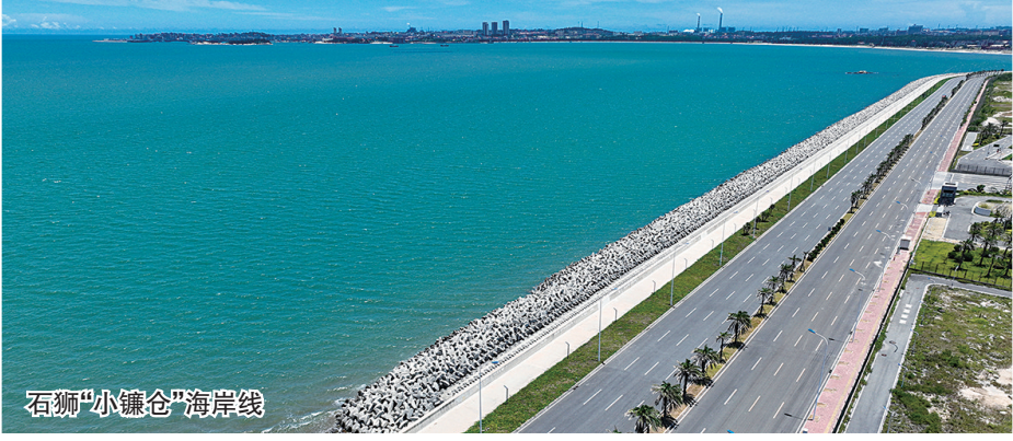
石狮“小鏰仓”海岸线