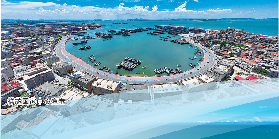
祥芝国家中心渔港