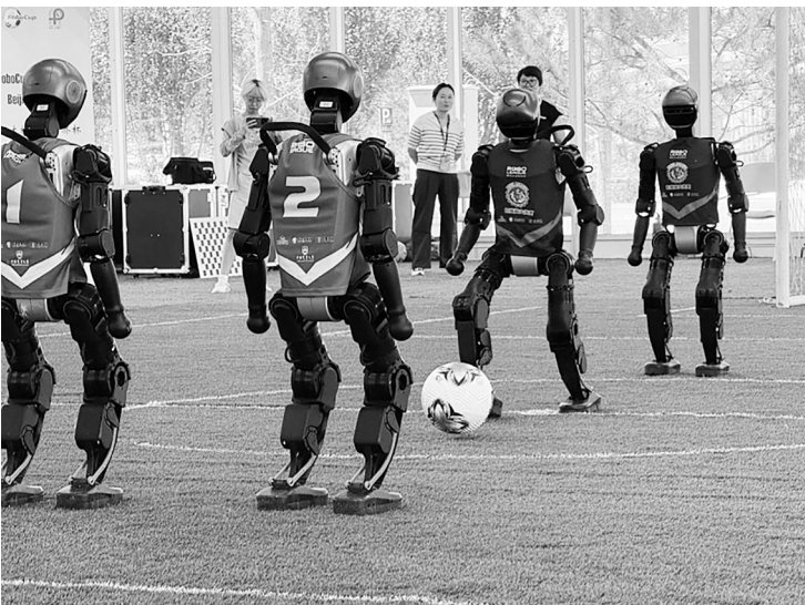
▲7月5日国家速滑馆人形机器人实训基地举办第一场训练赛,北京信息科技大学光焱队VS中国农业大学山海队现场赛况

据介绍,国家速滑馆人形机器人实训基地主要由“熊猫眼”核心区、室外足球配套区域和场景类测试赛区三部分组成,实现赛训有效衔接。本次启动的室外足球配套区域位于国家速滑馆南广场,在七人制足球场处设置临时篷房,面积约1800平方米。篷房内设5块足球场。基地配备了比赛所需的各种设备和技术支持设施,为参赛队伍创造了一个理想的训练环境。 北京市经济和信息化局相关负责人表示,实训基地的启用标志着赛事筹备工作进入一个新的阶段。参赛队伍在这里不仅可以进行技术训练和战术演练,还能够通过模拟比赛提前适应比赛节奏,提升团队的整体协作能力,帮助他们在即将到来的正式比赛中发挥出最佳水平。