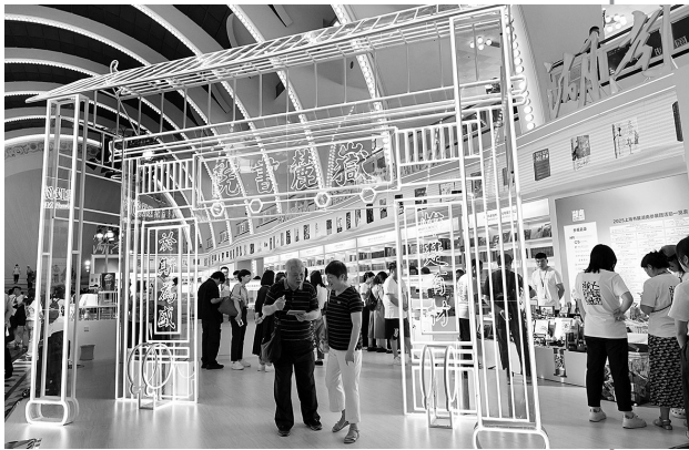
▲2025上海书展开幕 8月13日拍摄的2025上海书展主宾省——湖南省展位。当日,2025上海书展暨“书香中国”上海周拉开帷幕。本次书展首次设立上海展览中心、上海书城福州路店“双主场”,将持续至19日。

日说,以军目前控制加沙地带70%至75%地区,最新行动旨在“铲除”巴勒斯坦伊斯兰抵抗运动(哈马斯)在加沙的剩余两个据点——分别位于加沙城和马瓦西一带的中部难民营。扎米尔11日说,以军在加沙地带的作战进入“新阶段”。