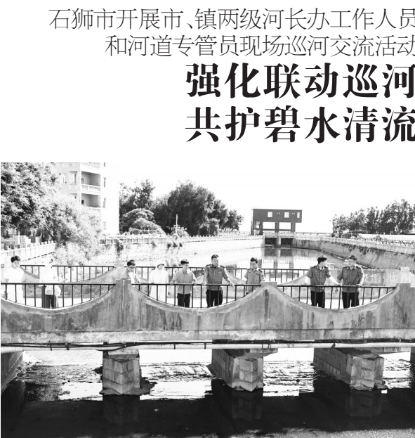
石狮市开展市、镇两级河长办工作人员和河道专管员现场巡河交流活动

新型工业化典型应用案例1个,培育省级新一代信息技术与制造业融合发展企业3家,另有5家企业9个场景入围省级智能制造优秀场景,形成“标杆引领、梯队跟进”的转型格局。紧跟泉州市中小企业数字化转型试点政策,精准匹配优质数字化服务商资源,先后推动56家企业跻身泉州市中小企业数字化转型试点,入选企业数量位居泉州市(市、区)第二位。