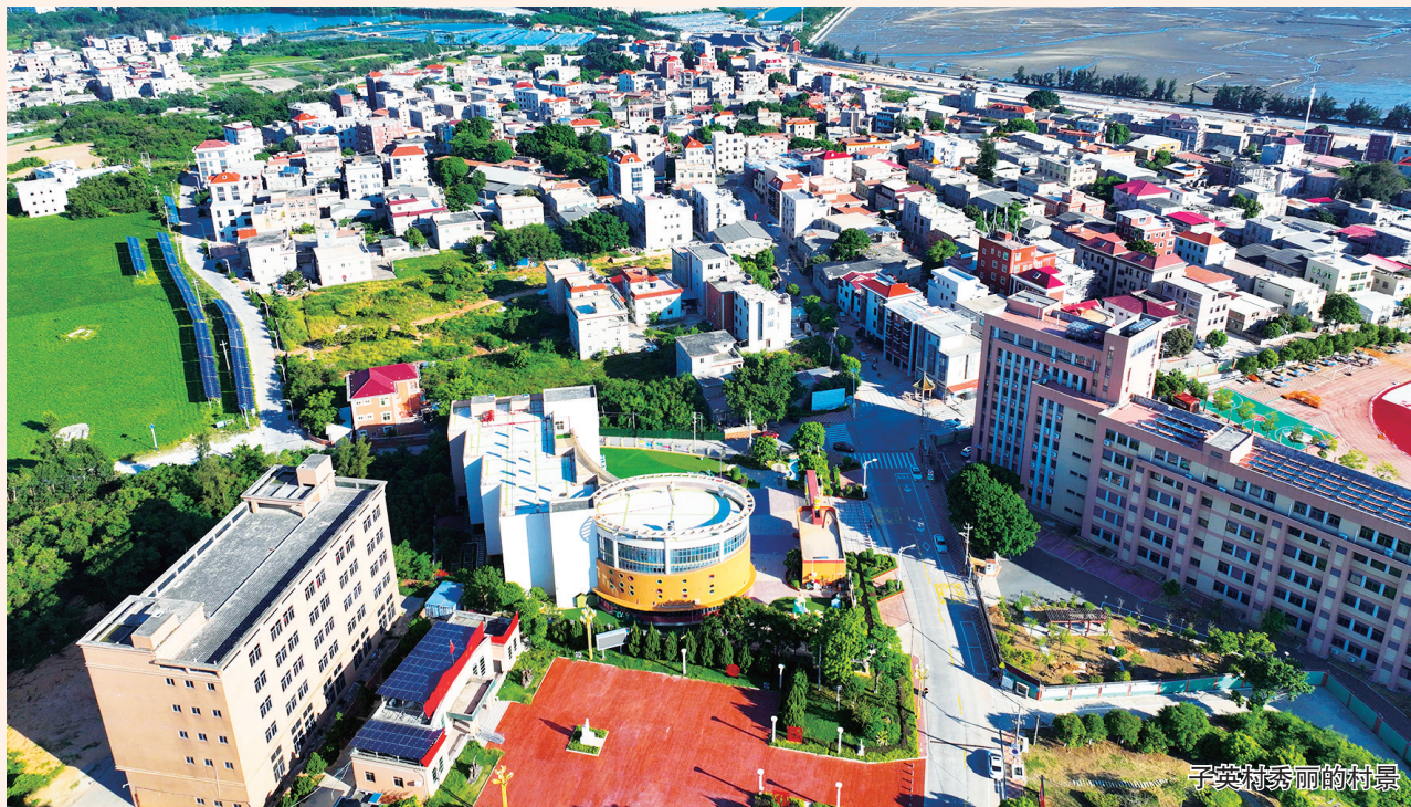
子英村美丽的村景

清新宜人的小公园、宽敞整洁的停车场、枝繁叶茂的树木……如今，走进永宁镇子英村，处处皆美景，步步闻花香，恍如走进了一处世外桃源。近年来，子英村党支部、村委会认真贯彻落实上级部署要求，带领村民大力推进乡村振兴，村容村貌发生了翻天覆地的变化。在基础设施建设方面，道路硬化、污水雨水分离管道埋设、绿化美化等工程有序推进，新建的公共厕所和停车场为村民的生活提供了便利。而为了增加村集体收入，摘掉“经济薄弱村”的帽子，子英村积极探索发展新路径，