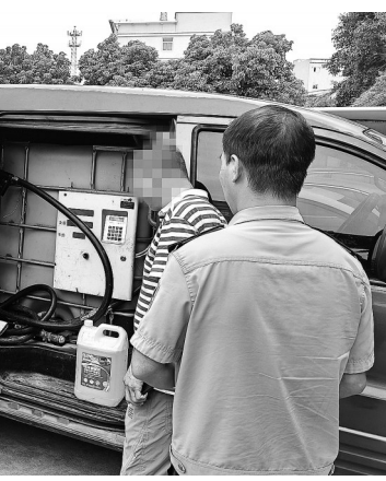
执法人员当即依法查扣车辆与油品,控制涉事司机,并对油品质量展开专业检测。

执法人员上前检查,打开面包车门,一股浓浓的柴油味扑面而来,车厢内竟藏着一套完整的非法加油设备,油罐、加油机、加油枪一应俱全,俨然一个移动的“黑加油站”。面对执法人员的询问,面包车司机神色慌张,闪烁其词,无法提供合法经营手