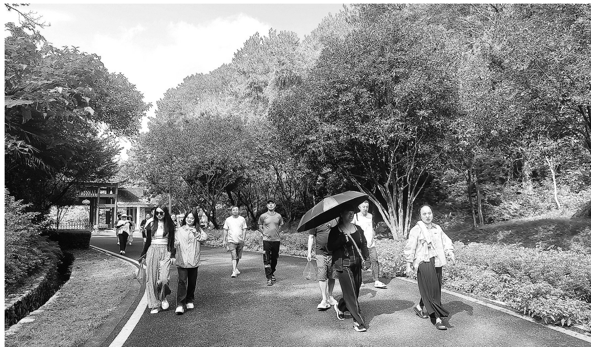
石狮市总工会首趟疗休养班发团