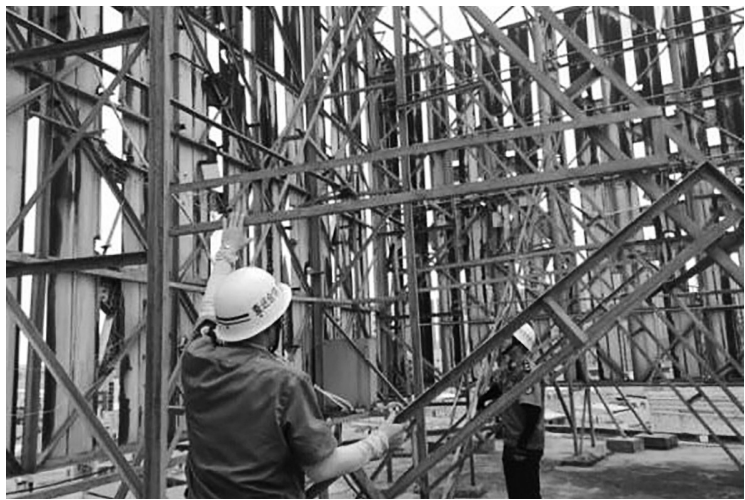
整改存在破损、松动等问题的广告设施,并通知19块大型广告中

9月22日,市城管执法局召开防御台风“桦加沙”动员部署会,明确要求各股室(下属单位)落实主体责任,强化应急值守和隐患排查。针对在建工地,市城管执法局执法人员重点检查围挡稳固性、物料堆放及临时设施防风措施,督促落实应急预案;同步开展违建拉网式排查,截至目前已完成40余处工地、50余处重点区域检查,整改隐患18起。户外广告方面,重点检查主次干道及人流密集区域广告设施196块,发现并整改户外广告问题1处,责令业主