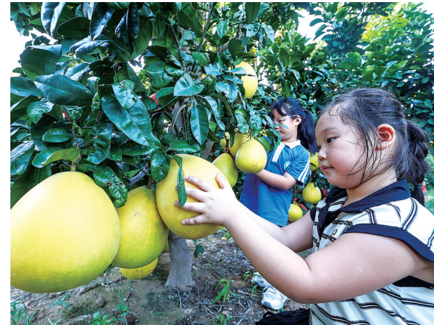
市民带孩子入园采摘柚子

近年来,我市把发展农业特色产业作为深入推进“百千万工程”的重要举措,立足湿地公园资源丰富、土壤肥沃、光照充足、气候适宜等优势,大力发展三红蜜柚、台湾蜜枣等特色水果种植产业,为群众拓宽增收致富途径。石狮湿地公园三红蜜柚种植基地通过科学管理,引进先进修枝、病虫害防治等栽培技术,因地制宜发展生态柚子产业,为乡村振兴注入强劲动力。(记者 兰良增 颜华杰)